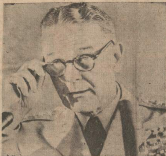
Gen. Maxwell Taylor, štabo vadų tarybos pirmininkas, Senato užsienio reikalų komiteto posėdyje pareiškė, jog jis ir kiti viršininkai visą laiką buvo informuojami apie vedamas atominės sutarties derybas ir kad jie tokią sutartį pritarė.

BEIRUTAS, Libanas. — Irako prezidentas Salam Arif kitą savaitę važiuos į Kairą tartis iš naujo su Nasseriu dėl jungtinės arabų respublikos sudarymo. Reikia pašalinti esminius nuomonių skirtumus tarp Egipto prezidento ir arabų Ba'ath partijos, kuri šį pavasarį užėmė valdžią revoliucijos keliu Irake ir Sirijoj. Abi šalys buvo pirmieji kandidatai į Nasserio jungtinę respubliką, bet kiek vėliau pabūgo Egipto įtakos ir dominavimo.