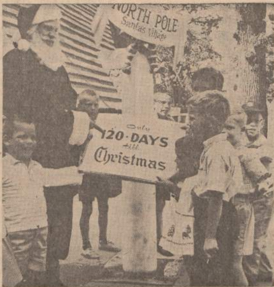
Netoli Dundee (Ill.) pasirodė iškaba, kuri primena, jog iki Kalėdų beliko tik 120 dienų.