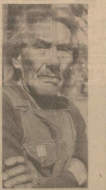
Irokvoju vadas šiandien

Mohavkai visoje Penkių Tautų Sąjungoje buvo laikomi narsiausi ir agresiviausi. Anglų ir olandų (Beje, olandai iš savo Naujojo Amsterdamo — vėliau New Yorko buvo įsisavinę beveik visą teritoriją, iš kurios susideda dabartinės New-