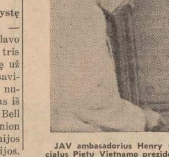
JAV ambasadorius Henry Cabot Lodge (kairėje) įteikia kredencijalus Pietų Vietnamo prezidentui Ngo Dinh Diem.