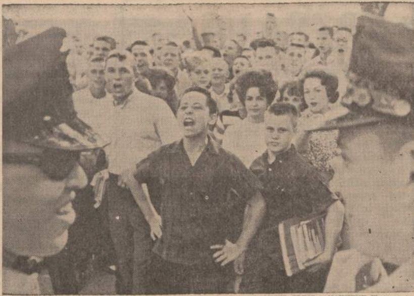
Baltųjų vyresniųjų sukurti mokiniai prie West End mokyklos Birminghame, Alabamoje, pradėjo protesto demonstraciją prieš dvi negres mokytojas, atvykusias į šią mokyklą mokyti.

"Mes lankėmės beveik visose Delavero miesto mokyklos klasėse, pradedant I ir baigiant XII. Ši mokykla buvo nurodoma kaip pavyzdinčiausia JAV mokykla savo pastatų, kabinetų modernumu ir pan. Reikia pripažinti, kad šioje mokykloje mes nematėme visų minėtų baisybių, tačiau pokalbiuose su amerikiečiais mes girdėdavome, kad šitokia mokykla netipiška JAV. Šioje mokykloje dirbama kabinetine sistema. Mokykloje plačiai naudojamos iliustracinės priemonės, kiekvienoje klasėje yra ekranas, nors kiekviena klasė ir neturi projekcinės aparatūros. Užsienio kalbų kabinetas turi visą techninę aparatūrą, skirtą kiekvienam mokiniui įkalbėtiems tekstams išklaudyti, įkalbėti ir pakartotinai perklausyti. Visų mokinių kabinos turi ryšį su mokytoju, esančiu prie valdymo pulto. Mokykla turi erdvias choro, sporto sales, dirbtuves su įvairiomis metalo ir medžio apdirbimo staklėmis, su traktorais bei ki-