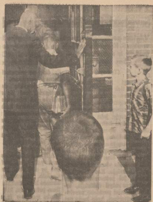
Alabamos nacionalinė gvardija sufederalinus ir gubernatorių George Wallace nusileidus, negru vaikai netrukdomi eina į baltųjų vaikų mokyklą.

Pradžioje Lenino oponentai turėjo didelę daugumą, ir kol ejo debatai dėl programos, tai kiekviename punkte jįsai būdavo sumušamas arba be didelio pasipriešinimo nusileidavo. Programos klausimais