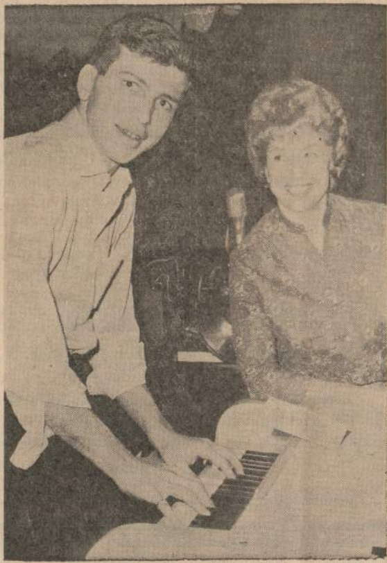
Frank Sinatra Jr. New Yorko naktiniame klube išbando Tommy Dorsey orkestro grojamą Celestą.