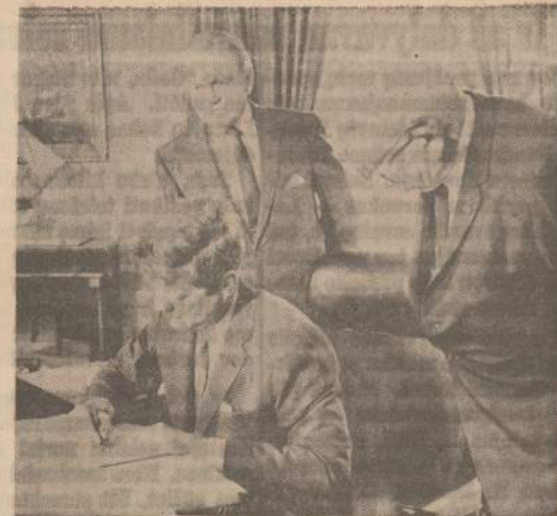
Prezidentas Kennedy pasirašo įstatymą, pagal kurį vedę vyrai bus atleidžiami nuo karinės prievolės.

GERBIAMAS NAUJIENU PRIETELI, PAAUKODAMAS NAUJIENU MASIŲ FONDUI ATLIKSI DIDELI IR GARBINGA DARBA. KIEKVIENA DIDELE AR MAZA AUKA BUS TINKAMA ĮVERTINTA.