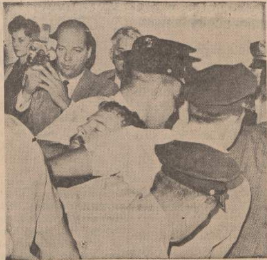
Policininkai neša triukšmadarį iš Neamerikoninės veiklos komiteto posėdžių salės, kur buvo apklausiunami Kubą aplankę studentai.

Turėdami tokias asmenybes naujieniečių gretose, mes esame drąsus sakyti, kad stovime ir stovėsime Lietuvos laisvės kovos fronto priešakyje ir iš jo nepasitrauksime, kol ir vėl bus laisva Lietuva. Dar būtinai pa-