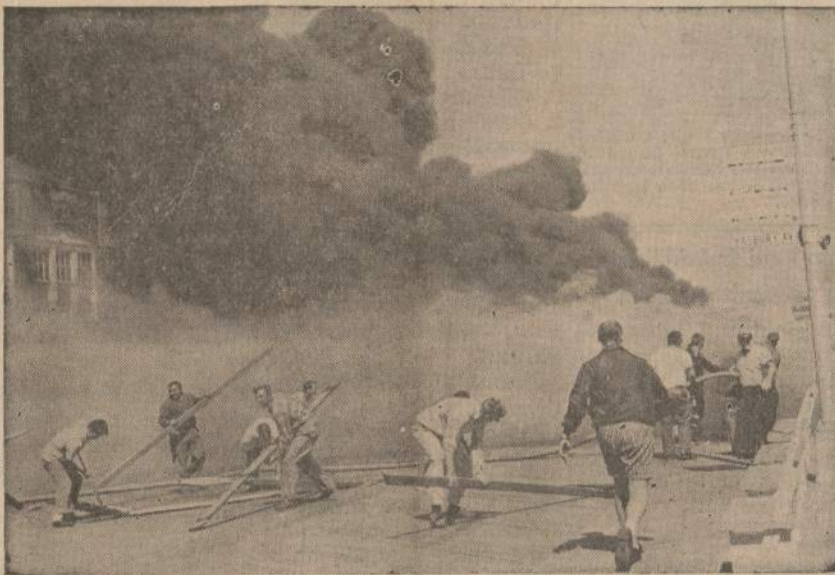
Gaisras sunaikino Asbury Parko (N. J.) First Avenue paviljoną.

gaitė. Aš nežinau, dėlko spauda man yra tokia baisi", ji stebėjosi. "Negalima gi visiems žmonėms įtikti, bet tatai nėra priežastis manęs tiek nekęsti".