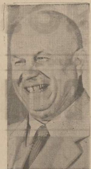
Prieš dešimt metų Nikita Chruščiovas buvo įvyktas Sovietų komunistų partijos Centralinio Komiteto pirmuo- ju sekretorium ir tuo būdu tapo Ru- sijos valdovu.