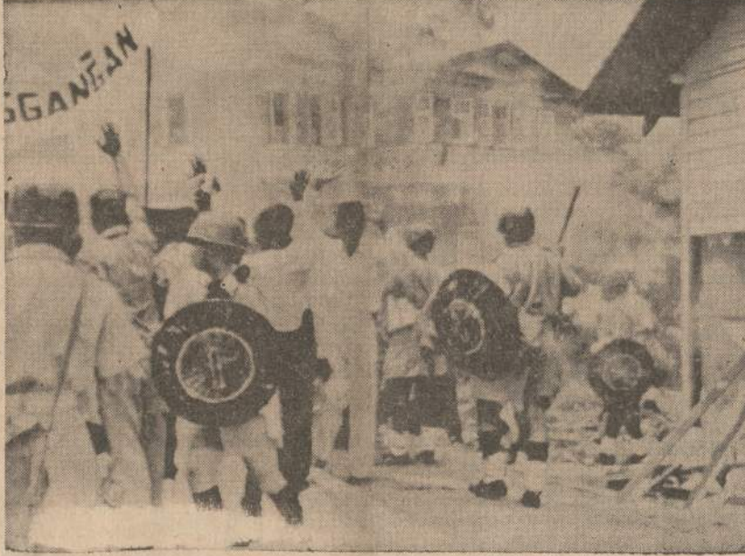
Kuala Lumpur mieste Malaysia federalinės valstybės policija stumia atgal demonstrantus, kurie susirinko prie Indonezijos atstovybės.

riausybės išsilaukymas yra tik laiko klausimas, — ji bet kurią dieną gali būti nuversta.