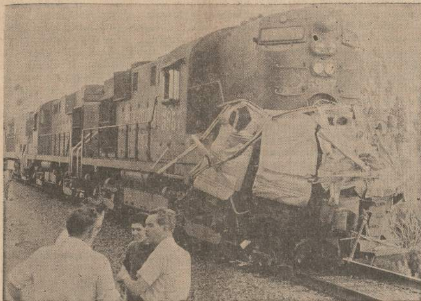
Traukinio garvežio priešakyje prilipę likučiai sunkvežimio, patekusio po traukiniu pervažoje prie Chualar, Kalifornijoje. Visi 28 autobusu važiuojantys darbininkai žuvo.

Pabaigoje sakoma, kad jeigu jau Rusija nenori nuo žydų persekiojimo susilaikyti, tai tegul nors leidžia žydams, kurie to nori, laisvai išvykti į kitus kraštus.