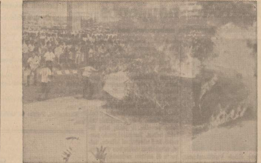
Indonezijos sostinėje minia atakuoja britų ambasadą, protestuodama prieš Malayzijos federacijos įsteigimą.

Haggerty pareiškė atsišaukias "į devynias dešimtasias dalis negrų rasės, arba 99 iš šimto, kurie yra dori žmonės, kad ignoruotų tą boikotą, sukeltą neatsakingų grupių, siekiančių su-