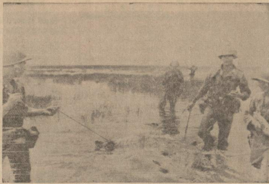
Pietų Vietnamo kariai velka nukautą partizaną palei Quang Lo kanalą.

Vėsiausias trečiadienį buvo dvi vietos: Washingtonas su 69 ir 39 laipsniais ir Philadelphia su 66 ir 35 laipsniais dienos ir nakties metu.