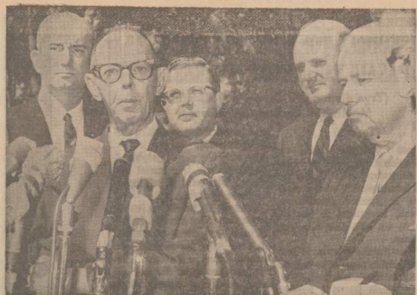
Penki baltieji iš Birminghamo, Ala., kurie buvo nuykę į Washingtoną išdėstyti savųjų pažiūrų, pareiškė, esą rasinė problema lengvai išsprendžiama, jei abi šalys sutarų "truputį laikytis taikos ir ramybės".

Maskvoje viskas nutariama "vienbalsiai". Diktatūroje kitaip ir negali būt.