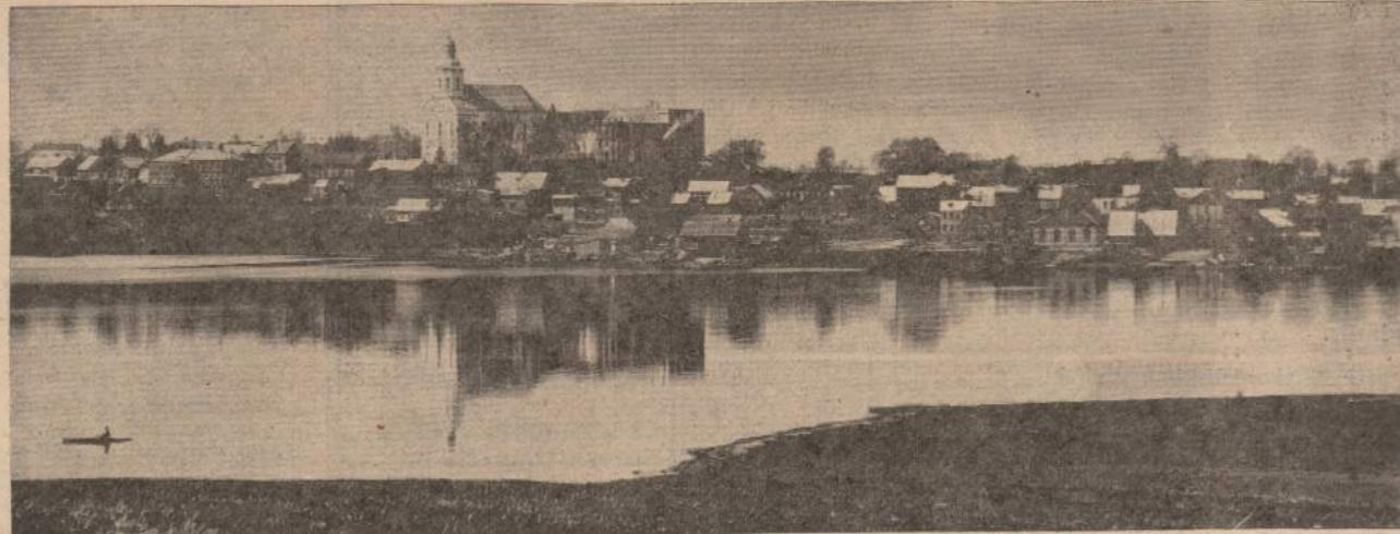
TELSIŲ MIESTO VAIZDAS NEPRIKLAUSOMOS LIETUVOS LAIKAIS. MASČIO PAKRAŠTYS