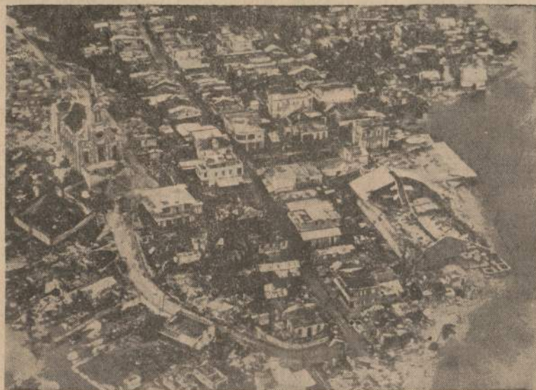
Bainet miestelio, Haičio respublikoje, reginys iš lėktuvo parodo, kokių nuostolių uraganas Flora čia pridarė.