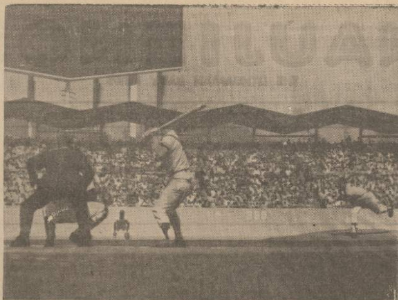
Dodgers beisbolo komandos žaidėjas Sandy Koufax pradeda ketvirtą rungtynių serijos žaidimą. Dodgers komanda laimėjo visus keturius žaidimus ir čempionatą prieš New York Yankees. Paskutiniai du rungtynių žaidimai įvyko Los Anželėje.