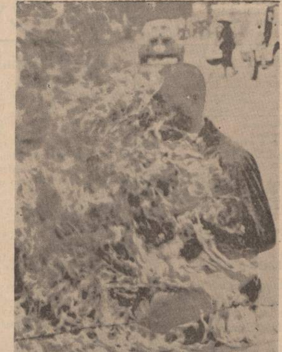
Šeštas budistų kunigas Pietų Vietnamo sotsinėje Saigone susidėgino apspilyęs benzinu. Už tokias nuotraukas Vietnamo policija smarkiai primušė tris Amerikos reporterius.