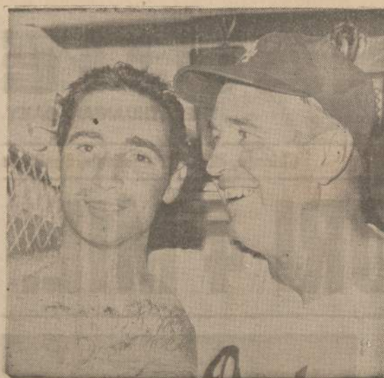
Los Angeles Dodgers beisbolo komanda po laimėjimo čempionato rungtynių su New York Yankees komanda.

AUKOKITE PATYS IR PARAGINKITE KITUS AUKOTI NAUJIENŲ MAŠINŲ FONDUI