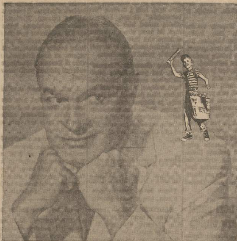
Bob Hope stars Friday nights on NBC-TV