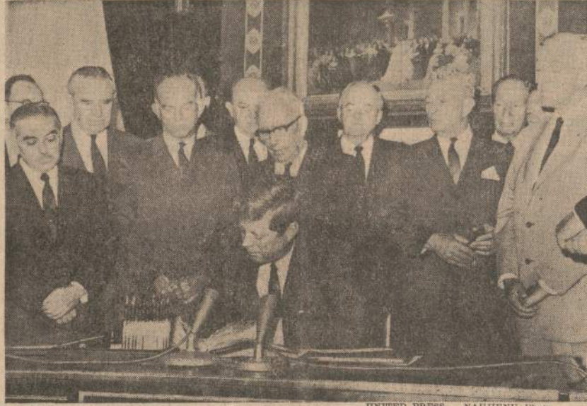
Prezidentas Kennedy pasirašo atominis bombų bandymų suvaržymo sutartį. Iš kairės į dešinę: senatorius John Pastore; W. Averell H. Harriman, valstybės sekretorius padėjėjas; sen. J. W. Fulbright; valstybės sekretorius Dean Rusk; sen. George Aiken; sen. Humbert Humphrey; sen. Everett Dirksen; William C. Foster, ginklų kontrolės ir nusiginklavimo agentūros viršininkas; sen. Howard Cannon, ir sen. Leverett Saltonstall.

Reporteriai konstatavo, kad Orchard, Rivington ir kitose žydų apgyventose gatvėse New Yorko beveik visos krautuvės — batų, drabužių, žaislų, dabar prekiauja ir šeštadieniais ir sekmadieniais.