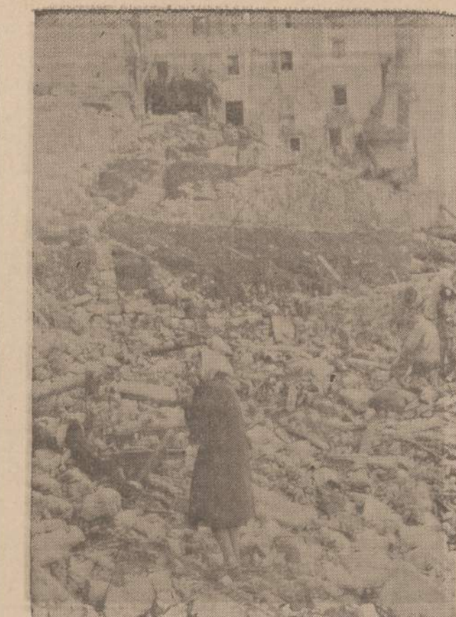
Moteris tarp Italijos miestelio Langarone griuvėsių. Miestelį sunaikino potvynis, — iš Vaiont tvenkinio išsiliejęs vanduo.

1446 S. 50th Ave., Cicero, Ill. Phone: OLYmpic 2-1003... Mirė 1963 m. spalio 11 d., 8:30 val. vakaro, sulaukusi pusės amžiaus.