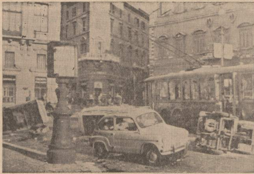
Romoje įvyko 20,000 statybos darbininkų streikas, kuris varto riaušėmis ir padarė daug nuostolių. Statybininkai sustabdo šešioms dienoms darbą, protestuodami prieš aukštus mokesčius.