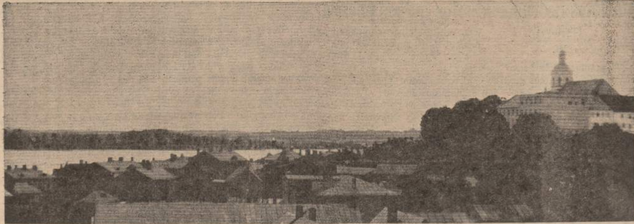
TELŠIŲ MIESTAS, FOTOGRAFUOTAS LIETUVOS NEPRIKLAUSOMYBĖS METAIS