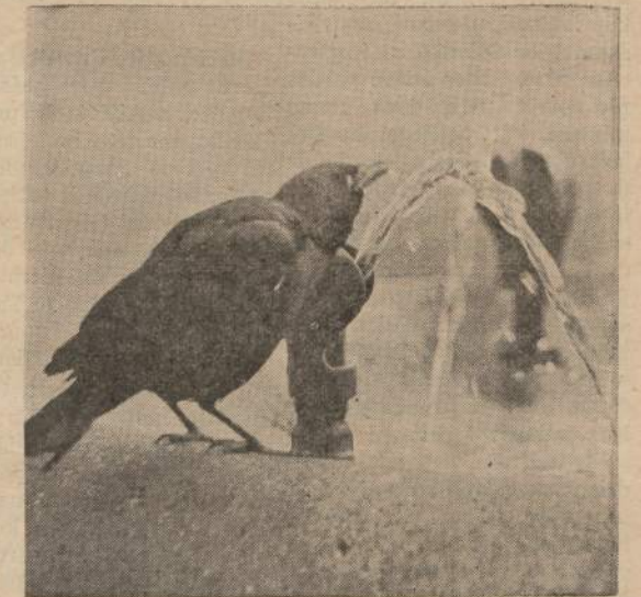
Varnėnas Lincoln Parke, Chicagoje, gaivinasis tekančiu fontano vandeniu.