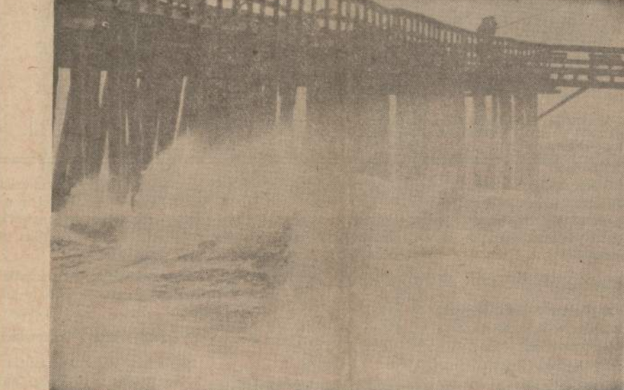
Uraganui "Ginny" pučiant Karolinos pakraščiais, vienas žvejas prie Manteo, N. C., bando atsilaikyti.