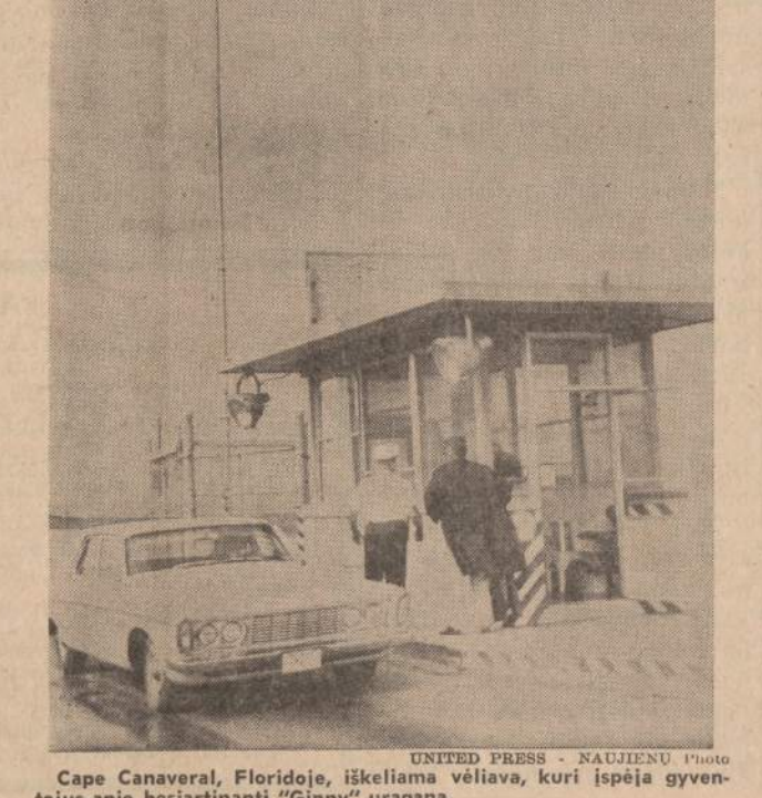
Cape Canaveral, Floridoje, iškeliama vėliava, kuri įspėja gyven-tojus apie besiriantinį "Ginny" uraganą.