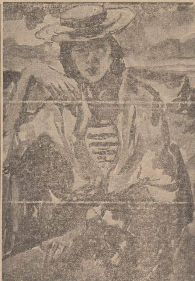
Dail. BR. MURINAS

Nors forma būtų tobiliausia, nebūs kontakto tarp aktoriaus