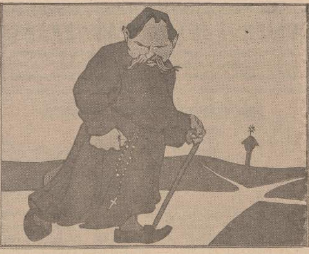
Iš dail. Adomo Varno garsiojo albumo “Ant politikos laktų”

Sutinku, mielas Skaitytojai, kad šiuos klausimus gvildinti ne būtina mano pareiga. Juos paliesti išdrįsau tikrai todėl, kad jie, mano manymu, gana svarbūs, bet vengiami tų, kurie paprastai rašo apie įvairius koncertus. Ne lengva pasakyti, kas varžo tuos, kuriems turėtų rūpėti šie reikalai. Kiekvienas recenzentas čia aiškintųsi savaip. Bet gal daugelio laikyse-noj būt pastebima atsakingumo stoka. Tūlam gal pats muziki-