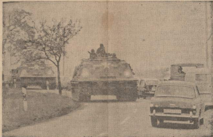
JAV 2-sios šarvuotos diviziono tankai prie Frankfurto, Vokietijoje, paruošti manevrams. Divizija buvo lėktuvais atgabenta iš Texas valstybės.