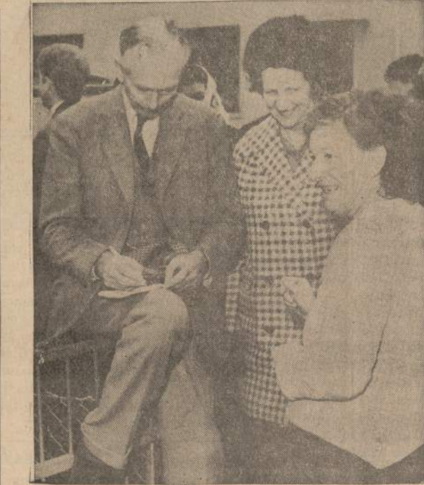
Britanijos ministras pirmininkas Sir Alec Douglas-Home pasirašinėja autografus.

Jie paaiškino, kad trys jų grupės vadovai esą slaptosios policijos pareigūnai ir šie grupės dalyvius nuolat seka. "Suolis į laisvę" įvyko prieš pat čekų šokėjų bei dainininkų grupei sugrįžtant į Čekoslovakiją. (E)