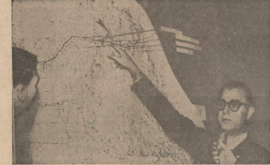
Jungtinių Tautų atstovas pulk George Creel rodo žemėlapyje karo pailauby liniją tarp šiaurinės ir pietinės Korėjos, kurią komunistai jau kelis kartus pažeidė, užpildinėdami beginklius Amerikos karių ir pietinius korėjiečius.

Lapkričio 8 d. šitoks kiekis buvo parduotas už $7,600,000, o kitas tokio pat dydžio pirkinys ketvirtadienį — už $8 mil.