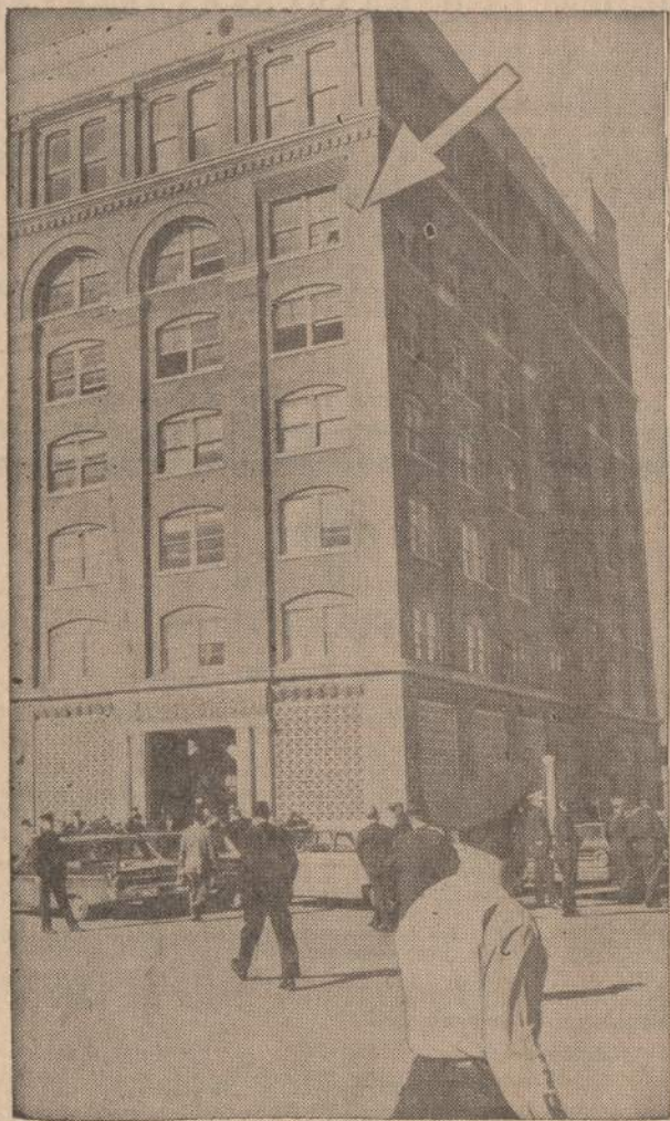
Strėle atžymėtas Dallas (Tex.) paštas, pro kurį žudikas paleido mirtiną šūvį į prezidentą John F. Kennedy.

VEDYBU TIKSLU noriu susipažinti su vyresnio amžiaus negeriančiu, inteligentišku vyriškiu. Pageidaučiau su profesija ir pasiturinti. Turū savo nuosavybę. Rašyti: Naujienos, Box 4906, 1739 So. Halsted Street, Chicago, Ill. 60608