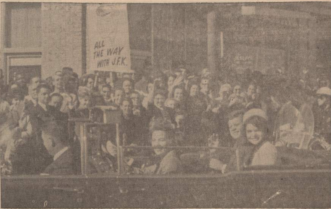
Automobilije matosi prezidentas John F. Kennedy ir jo žmona. Po kelių minučių, kai ta nuotrauka buvo nuimta, prezidentas Kennedy tragiškai žuvo nuo žudiko paleistos kulgos.

Skrendant į Viršuvą kėltuve varoma agitacija, kad turistai lankytų Lenkiją. Pasakoja, jog net medžioklinius šautuvus su šimtu šovinių galima įsivežti ir aiškina, kur ir kokiose vietose leidžiama medžioti. Varšuvos aerodrome kontrolė buvusi trumpa. Nereikalauta, kaip kitose komunistinėse šalyse, pasisakyti, kiek turi pinigų.