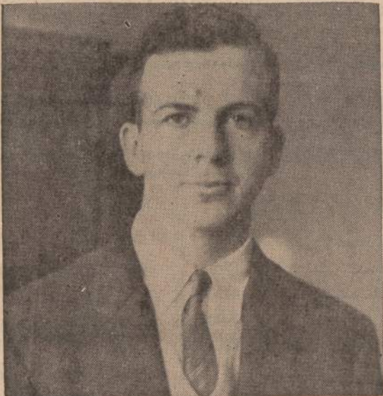
Lee H. Oswald, kuris yra suimtas ir kaltinamas prezidento John F. Kennedy nušovimu. Be to, jis yra kaltinamas ir Dallas (Tex.) policininko nužudymu. Oswald pasiūlymą kaip Kubos diktatoriaus Castro pasekėjas. Jis buvo "Fair Play for Cuba" komiteto pirmininkas.

Lee H. Oswald, 24 metų amžiaus, pastaruoju metu gyveno atskirai nuo savo žmonos ir dviejų mažamečių vaikų. Ji su vaikais ir jo motina buvo šeštadienį atvykusi į kalėjimą jį aplankyti. Jo tėvas mirė prieš jam gimstant. Jis turi du brolius, vyresnius už save.