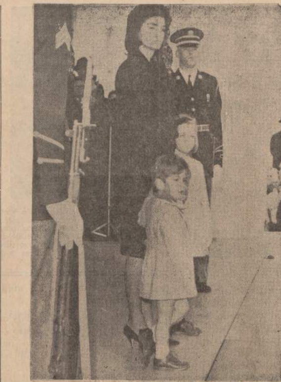
Mrs. Jacqueline Kennedy su dukterim Caroline, 6 metų, ir sūnum Johnu, 3 metų, Baltųjų Rūmų Rytų kambary, kur buvo pastatytas karstas su vyro palaikais.

Kalbėtojas pasakojo, jog tik atsilikusiuose kraštuose, kaip pietinė Amerika, kariuomenė nuolat artalioja valdžias. Lietuvoje kariuomenė į politiką nesikišusi.