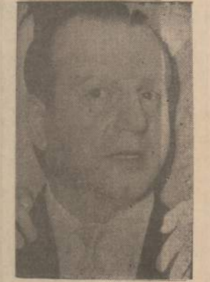
Dalla, Tex., dviejų naktnių klubų savininkas Jack Ruby-Rubinstein. Jis mirtinai periovė policijos būstinės rūsyje prezidento Kennedy žudiką Lee Oswald, kai jis buvo gabenamas į saugesnį apskrities kalėjimą.

Tiesia, kad senosios kartos lietuvių savo trisus, prakaitu ir sutauptais dolerių gražių pastatų pristatė. Bet kam visa taiti atiteks? Juk dar nepradėję statyti turėjo žinoti, kad ne naujosios kartos lietuvių paveldės savo senosios kartos išstatytas milijonines bažnyčias, bažnytnines mokyklas ir ilgonines, o svetimtaučiai... Tai galime aiškiai pasakyti ir