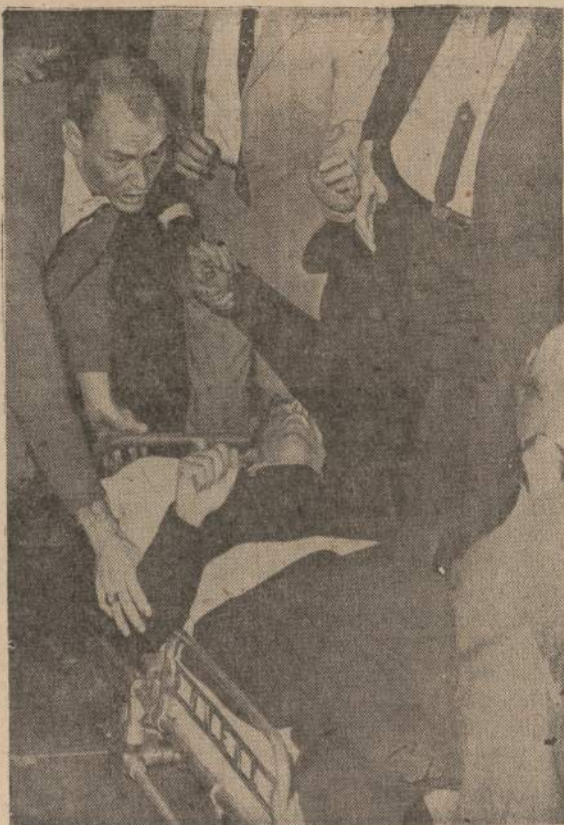
Lee H. Oswald, apkaltintas prezidento Kennedžio nužudymu, buvo mirtinai sužeistas ir mirė ligoninėje, nebeatgavęs sąmonės. Jį nušovė Jack Ruby, Dallas restoranų savininkas.