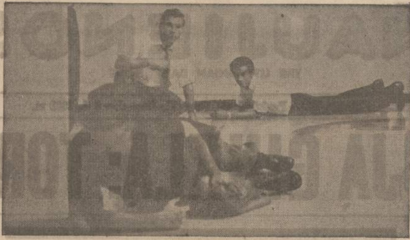
United Press International tarnautojai Caracas mieste, Venecueloje, sugulė ant grindų, kai teroristai pradėjo šaudyti. Vienas tarnautojų buvo sužeistas.

Straipsnio autorius V. Std. patelkęs visą eilę netikslų kaltinimų dabartinei Lietuvos Skautų Sąjungos ir Brolijos vadovybei, vistiek turėjo drąsos pasakyti tiesą, kad 1963 m. pradžioje "jūrų skautų vadai" nutarė jūrų skautų ir skautų vienetus ištraukti iš Lietuvos Skautų Brolijos ir Seserijos. Tačiau jis ne-