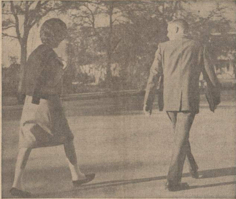
Lynda Bird Johnson, prezidento Johnsono duktė, eina į pamoką, lydima slaptosios tarnybos agento. Ji lanko Texas universitetą, Austine.

Jie pritaria erdvių, raketų centro pavadinimui Kennedy vardu, bet priešinasi geografinių vardų keitimui. Prezidento Johnsono nutarimą dėl formalu-