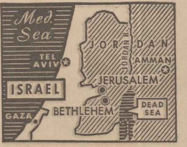
Popiežius Paulius VI kitą mėnesį ketina aplankyti "šventąją Žemę", kurios žemėlapis čia spausdinamas.

NAUJIENOS BOLSEVIKAMS YRA RAKŠTIS JU AKYSE