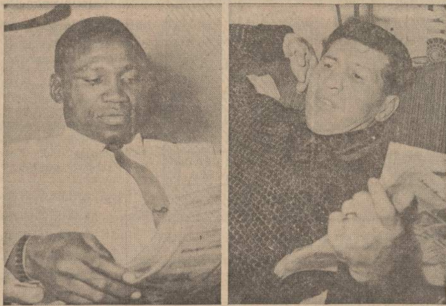
Rytoj, Atlantic City (N. J.) ringe Joey Giardello (dešinėje) bandys atimti vidutinio svorio bokso čempionatą iš Dick Tiger, kuris yra kilęs iš Nigerijos, Afrikos.

Visame krašte daromi tyrinėjimai parodė, kad substancija, kuri yra panaši į baltus miltelius, nėra nuodinga ir taip pat gelbsti nuo taisyrių grybeliais (fungi) apskritimo kitose kūno vietose. Preparatas skystoje formoje užtepamas ant odos iš viršaus ir sustabdo niežėjimą, 24-48 valandų laikotarpyje užmušdamas infekciją sukėlusius fungus.