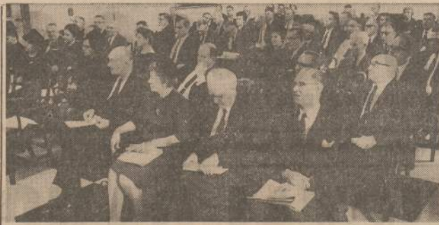
1963 m. lapkričio 23—24 d. d. Vliko atstovų suvažiavimo dalyvių dalis.

1946 m. atėjus žinioms apie Lietuvoje sovietų valdžiai pradėjus masiniai deportuoti gyventojus į Sibirą, apie šį bolševikų genocidinį nusikaltimą Vlikas per Lietuvos pasiuntinį Vašingtone 1946 m. spalio 30 d. kreipėsi į J. Tautų Gen. Sekretorių. Ateinant naujoms žinioms apie išvežimus, Vlikas 1947 m. lapkričio 6 d. kreipėsi į J. Tautas su nauju memorandumu ir šį kartą buvo prijungti išdeportuotųjų žmonių pavardžių bei profesijų padėties sąrašai. Pa-