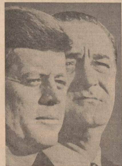
Iš 1960 metų konvencijos: Senatoriai J. F. Kennedy ir Lyndon Johnson priima nominaciją demokratų partijos konvencijoj Los Angeles mieste, pirmas — prezidentas, kitas — viceprezidentas.