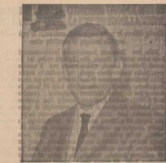
Senatorius Clair Engle, kuriam prieš kelerą savaitių buvo padaryti labai sunki operacija. Jis yra demokratas ir atstovauja Kalifornijos valstybei.

Pirmieji bandymai su imuranu buvo daryti pacientui prisivėsus svetimą (skolintą) inkstą. Šiaip, skolintąs prioperuotas svetimas inkstas išbūna gyvas tik