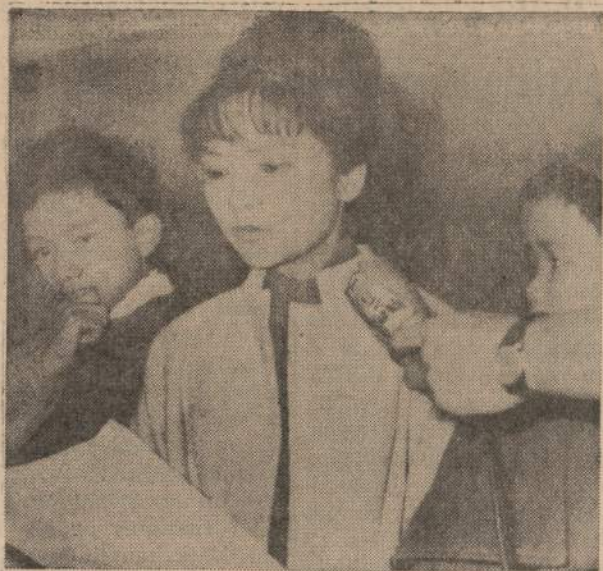
Vadinamoji "Vietnamo tigė", Madame Nhu, kurios vyras ir svainis (Vietnamo prezidentas) buvo nužudyti sukilimo metu, nutarė su savo vaikais apsigyventi Paryžiuje.