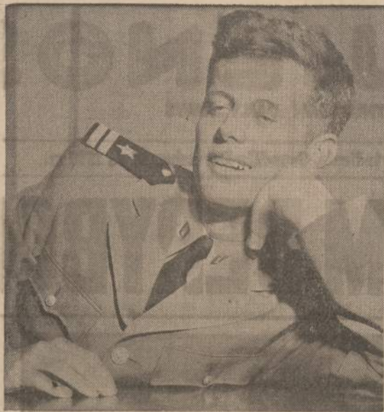
J. F. Kennedy 1944 metais: Laivyno jaunesnis leitenantas, nedidelio torpedaivio vadas John F. Kennedy Šyposi gavęs atostogų Pacifiko kare.