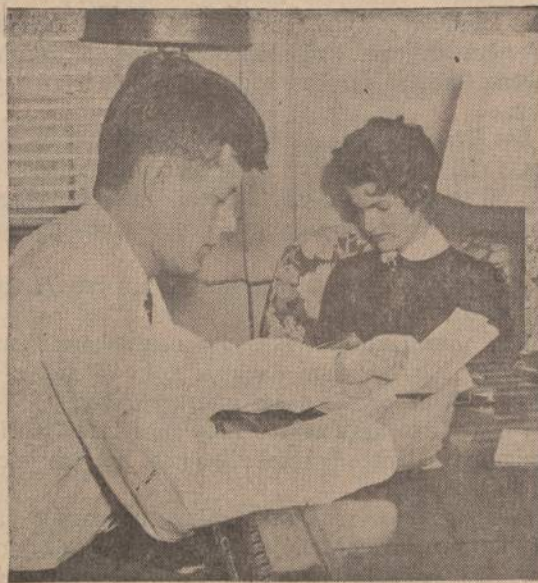
Kennedžiai jaunavedžiai: Ka tik išrinktas į senatą J. F. Kennedy 1953 metais susituokė su Jacqueline Bouvier ir apsigyveno Vašingtone.