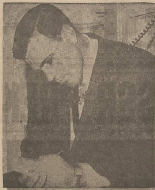
Ara Parseghian, aštuonerius metus išbuvus Northwestern universiteto futbolo treneriu, priėmė Notre Dame (South Bend, Ind.) universiteto pasiūlymą vadovauti to universiteto futbolo komandai.

Ross Thatcher yra pats buvęs Saskatchevano provincijos parlamento socialistų frakcijos nariu. Prieš keletą metų jis pabėgo nuo socialistų ir parėjo pas liberalus, žadėdamas jiems sutruškinti tuomet dar Tomo Douglaso vadovaujamą Saskatchevano socialistų vyriausybę. Liberalai padarė jį savo lyderiu toje provincijoje, ir per paskutinį rinkimus, kurie įvyko 1960 metais, Thatcher išėjo su didžiausia pompa į kryžiaus karamą prieš Tomy Douglas, žadėdamas pergale liberalams. Įvyko betgi ne taip, kaip svajojo antisocialistinis Saskatchevano kryžiuotis. Socialistai buvo sugrąžinti į vyriausybę, pravedami 34 atstovai į provincijos parlamentą, Thatcher liberalai pravedė 21 atstovą ir liko, kaip