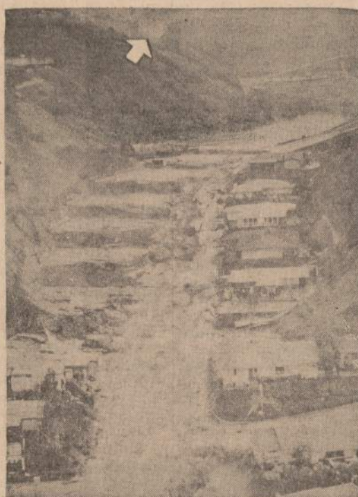
Dešinią Baldwin Hills (Calif.) gatvės pusę, kur namai išliko sveiki, kai kairiosios gatvės pusės namai buvo sunaikinti vandens, kurio milijonai galtonų prasimušė pro pralaužtą kalne esančio rezervaro sieną.