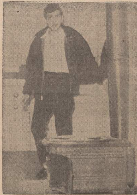
Frank Sinatra Jr. parodomas namelio viduje, kur jis buvo laikomas, kai žmogavai vedė derybas dėl jo išpirkimo. Sumokėjus $240,000, Sinatra buvo paleistas. Federalinės valdžios agentai tris žmogavgius jau suėmė ir beveik visus jiems sumokėtus pinigus atgavo.

• Žurnalistų Los Angeles skyriaus valdybos fotografiją išspausdino Draugo dienraštis, apipintą šitokiomis mintimis: "LŽS, kad ir atsidūrusi nenormaliose tremties sąlygose, tu-