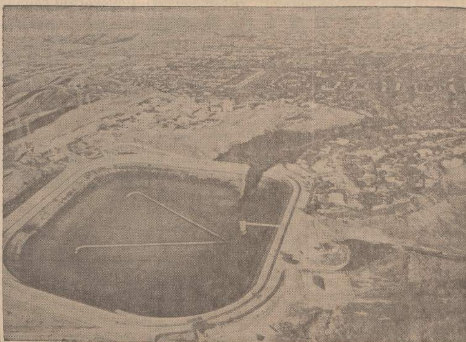
Baldwin Hills (Calif.) rezervuaras, pro kurio pralaužta siena prasimušė vanduo, sunaikindamas 60 brangių namų ir apgraudamas apie 200. Nuostoliai siekia apie 10 milijonų dolerių.

Tos didžios idėjos, kurios sudaro minėtų lietuvių politinių srovių pagrindus, būdamos visuotinės reikšmės, nėra vienu lietuvių nuosavybė. Jos yra bendros visam kultūringam pasauliui.