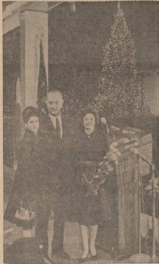
Prezidentas Lyndon Johnson, žmona ir duktė Lucy (kairėje), uždegant prie Baltųjų Rūmų Kalėdų eglutę.