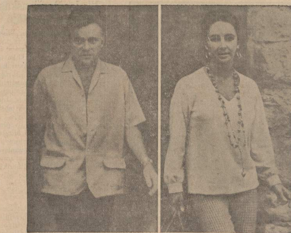
Elizabeth Taylor ir Richard Burton, pagarsėję filmų aktoriai, Kalėdas praleis Puerto Vallarta, Meksikoje.

Pravažiavęs Roscoe Street, banditas studentui įspraudė $5 ir liepė išlipti laukan ir pasisamdyti taksį.