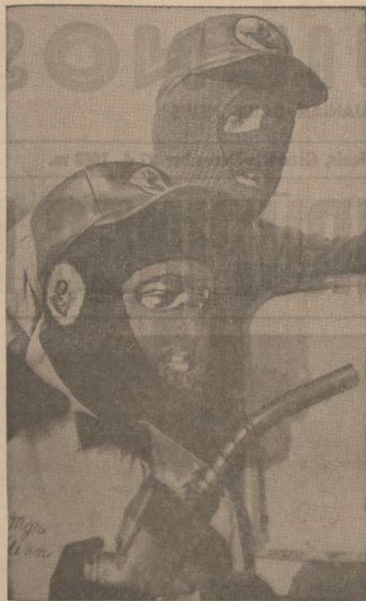
Kai temperatūra labai nukrito, tai Evansville (Ind.) gazolino stoties tarnautojai užsėdėjo specialias kaukes, kad apsaugotų veidą nuo šalčio.