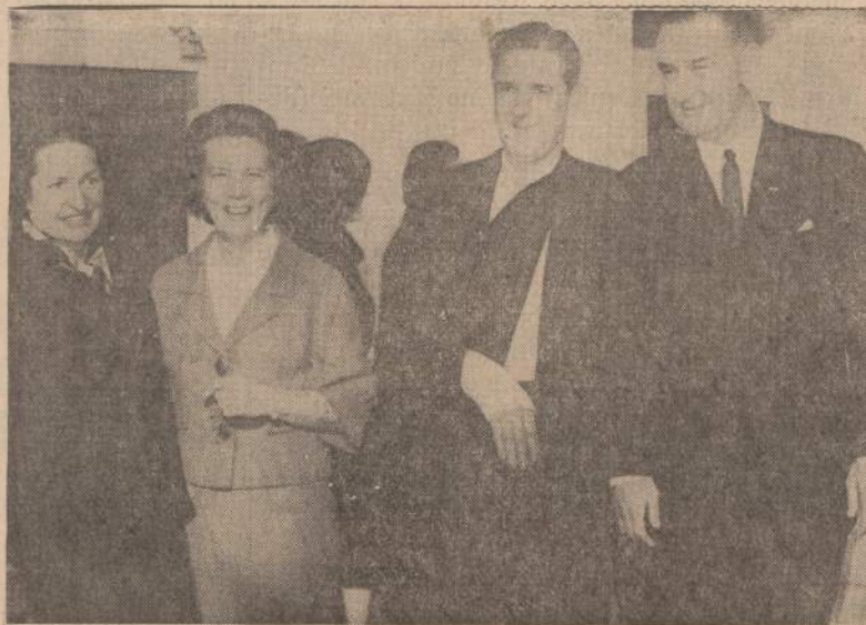
Prezidentas Johnson (dešinėje) ir jo žmona (kairėje), žiemos švenčių proga vykdamie į savo farmą Texas valstybėje, pirmiausia aplankė Texas gubernatorių John Connally ir jo žmoną (viduryje). Kaip žinia, gubernatorių Connally važiuo kartu viename automobilyje su prezidentu Kennedy ir buvo sunkiai sužeistas to pat žudiko, kuris nušovė prezidentą.

Federal Home Loan Bank Board paskelbti duomenys rodo, kad taupmenos auga daugiausia Amerikos vakarinėse valstybėse taupymo bendrovėse. Per pereinamus metus taupmenos paaugo Kalifornijoje 24%, Nevadoje 131%, Arizonoje 34% ir net Aliaskoje 43%. Tuo tarpu rytinėse valstybėse taupmenų prieauglis yra daug mažesnis. New Yorke valstybės taupymo bendrovėse santau-pas paaugo 11%, Connecticut — 8%, Massachusetts — 11%, Illinois valstybėje taupmenų padidėjo vidutiniškai 13%, Wisconsin tik 10%. Šie skaičiai rodo, kad ekonominis gyvenimas vystosi vakarų valstybėse daug spartesniais žingsniais, nei rytinėse ar vidurinėse valstybėse. Vakaruose daugiau steigiami naujų įmonių, daugiau statoma naujų gyvenamųjų namų. Taip pat daug Amerikos gyventojų keliasi gyventi į vakarines valstybes. Paskui žmonės seka ir pinigai. Ka-