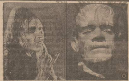
Prieš keturiasdešimt metų su viršum buvo pagamintas "Dr. Jekyll and Mr. Hyde" filmas, kuris vaizdavo dvilytę dr. Jekyll'o asmenybę: žymų mokslininką, kuris savo išrasto preparato pagalba virsdavo pabaisa Hyde ir naktimis siausdavė ir žudydavo žmones. Pirmame "Dr. Jekyll and Mr. Hyde" filme vaidino garsusis John Barrymore (kairėje), o vėliau pagamintame — Boris Karloff. Abu filmai dabar rodomi televizijoje.

— Iš tokių žmogelių juokiamasi, apgailestaujama. Tokie sugrįžėliai laikomi propagandos apgauti, jie užjaučiami, išskyrus tuos, kurie ir toliau už "Judo grašius" užsiima komunistiniais plepalais. Kitų nuomone, atsiranda ir tokių lietuvių, kurie nesmerkia sugrįžusiųjų.