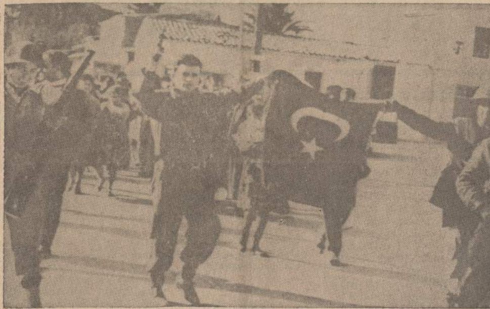
Graikų kariai lydi Nicosia mieste, Kipro saloje, graikus į saugesnę vietą. Jau kelintą dieną tarp to miesto graikų ir turkų eina kruvini susirėmimai.

Per tuos penkis šimtmečius šios dvi krikščionių bažnyčios jokių ryšių nepalaikydavo.