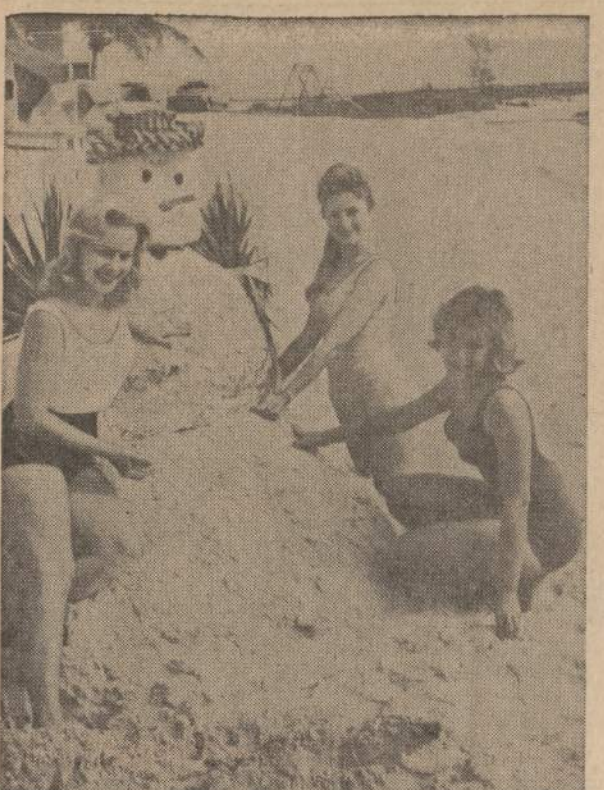
Marathon (Fla.) paplūdimyje merginos iš smėlio nupildė „sniegžmogį“, kad jį primintų iš šiaurės atvykusiems turistams apie žiemą.

warde balsuotojų, kurie gyvena universitetui skirtoje srityje, neteko visko, kas jiems buvo brangu: savo namų, biznio vietų, bažnyčių, mokyklų ir visame pasaulyje garsaus Hull House.