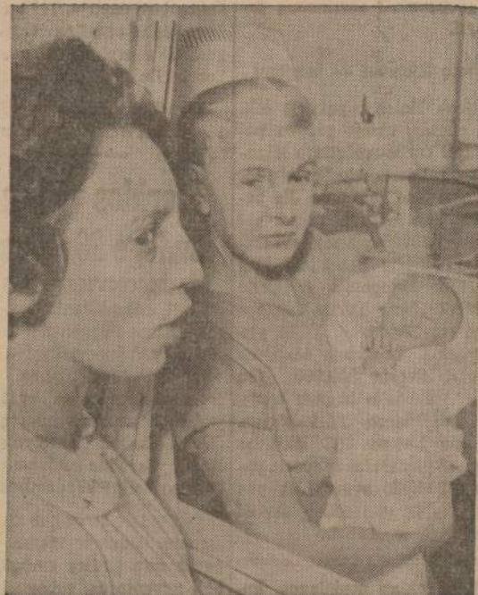
St. Petersburg (Fla.) ligoninėje Kalėdų dieną gimė berniukas, kurio tėvų pavardė yra Christmas (Kalėdos).