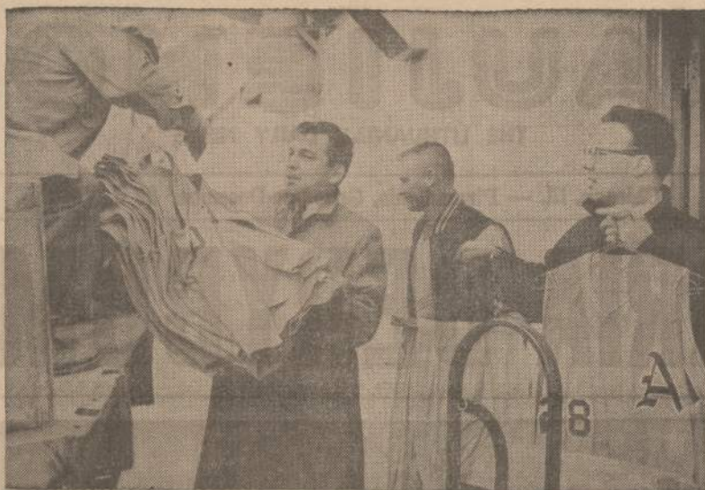
Iš Kansas City (Mo.) miesto stadiono išsitraukto Kansas City A's beisbolo komanda, protestuodama prieš stadiono vadovybės neurilintinas sąlygas.