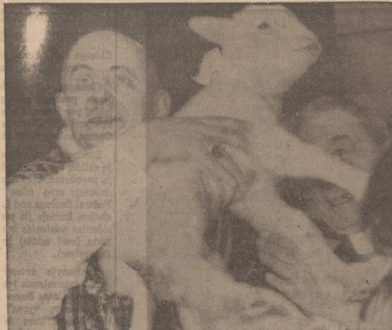
Popiežius Paulius VI iškelia avinėlių kaip taikos simboli.

Apdraustas perkraustymas IS TOLI IR ARTI... 2022 W. 69th Chicago 36, Ill. Tel. Walbrook 5-9209