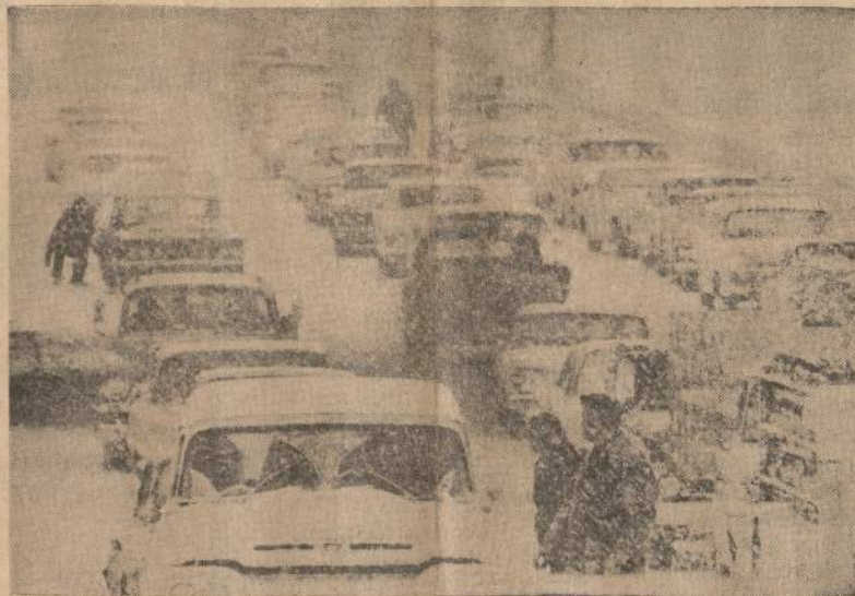
Atlanta (Ga.) mieste ir jo apylinkėse sniegas užvertė kelius ir suparalizavo automobilių judėjimą.

Sovietai paleidžia kas savaitę TU-114 tipo keleivinį lėktuvą iš Maskvos į Havaną. Lėktuvai pasirodė 6,700 mylių kelionei be sustojimo Murmanske, šiaurinė Rusijoje, ir skrenda per Grenlandiją, Islandiją ir JAV pakraščiais iki Kubos.