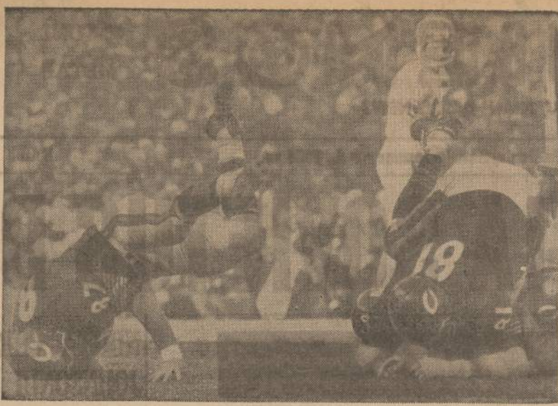
Chicago's Bear futbolo komandos nariai savotiškos gimnastikos pagalba laimėjo rungtynes ir čempionatą iš New Yorko Giants. Rungtynės vyko Chicagoje.

Norėjau tuos pačius klausimus ir kitiems pastatyti, bet ne drįsau. Žinau, kad jie yra pusėtinai fanatikai, Kremlius smarkiai užhipnotizuoti, tai naudos iš to nebūtų buvę. Geriausia, žinoma, būtų, jeigu jie ne Floridon, bet nuvažiuotų į Batumą ir pamatytų kaip ten Stalino ainių saulė kaitina.