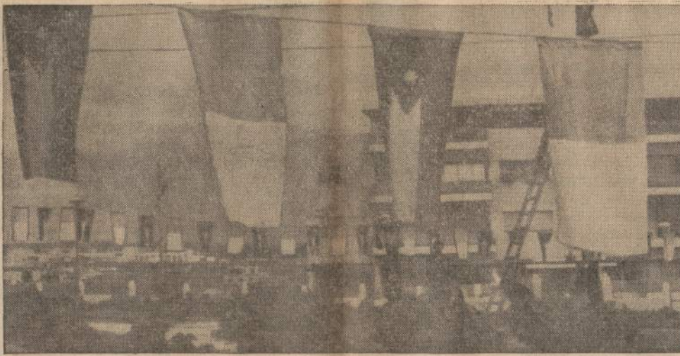
Jordanas pasirodė iškilmingai sutikti popiežių Paulių, kurio atsilankymo progą Amman miesto gatvėse jau pasirodė popiežiaus ir Jordano vėliavos.

• Kipro respublikoj įtampa atslūgo, priėmus anglų pasiūlymą šaukti taikos konferenciją Londone šį mėnesį. Joje dalyvaus Anglija, Graikija, Turkija ir Kipro salos graikų, turkų bendruomenių atstovai.