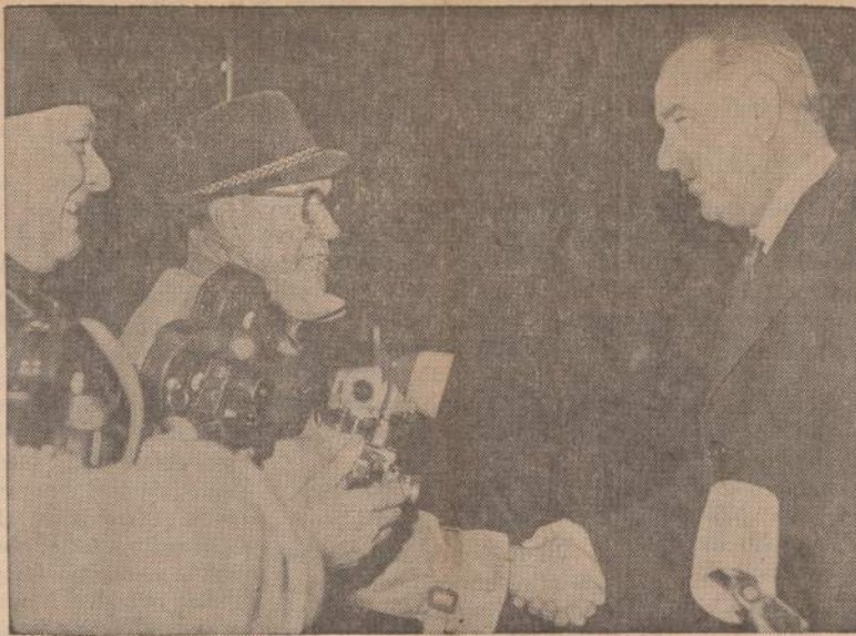
Reporteriai ir fotografai pasitinka aerodrome grįžtantį iš Texas į Washingtoną prezidentą Lyndon Johnsoną.

"Naujienos" bolševikams yra rakštis jų akyje!