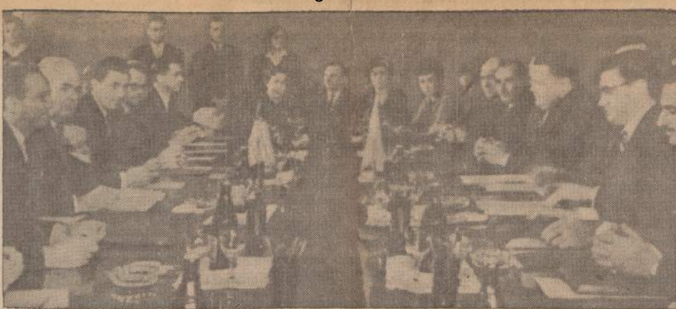
Kultūrinių mainų derybos. — Maskvoj prasidėjo Amerikos-Sovietų derybos dėl naujos dviejų metų kultūrinių mainų sutarties.