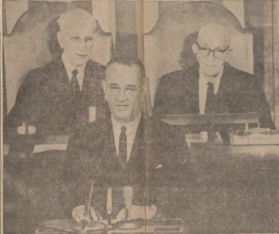
Prezidentas Lyndon Johnson pasakė kongrese trečiadienį programinę kalbą (apie padėtį Unijoje). Užpakaly: atstovų rūmų pirmininkas McCormack (kairė) ir senato — Hayden.