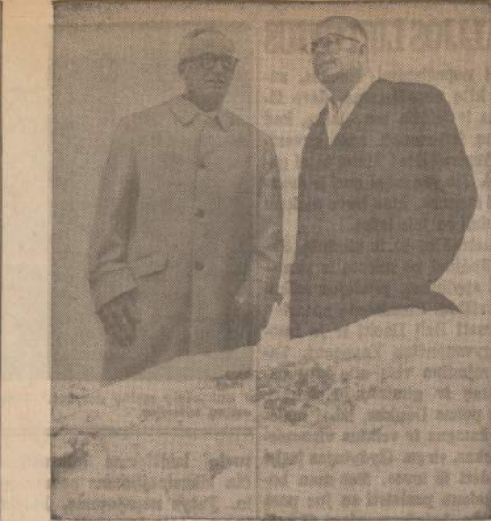
Sen. Goldwater ir prezidentus. Konservatyviųjų respublikonų vadovas sen. Barry Goldwater iš Arizonos (kairė) pasiskelbė kandidatu į prezidentus. Kovą už nominaciją pradėjo New Hampshire valstybė. Respublikonų senatorius Norris Cotton iš šios valstybės yra jo rinkiminės kovos pirmininkas.