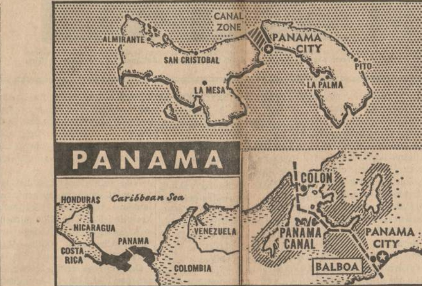
Krizė Panamoje. Žemėlapyje parodyta Balboa ir Panama City (Panamos Miestas), kur prasidėjo riaušės dėl to, ar Amerikos ar Panamos vėliava ar abidvi turi būti iškėlimos viršum amerikiečių aukštesniosios mokyklos Panamos kanalo zonoje. Visoje zonoje paskelbtas karo stovis.