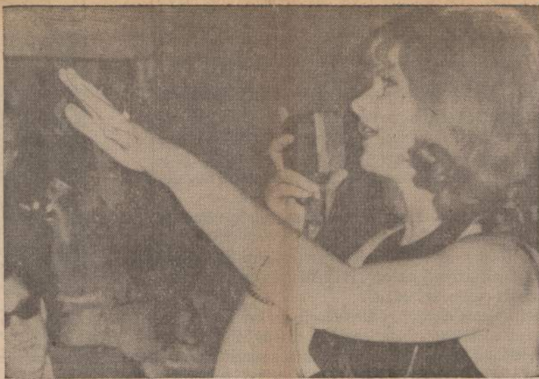
Mandy Rice-Davies, kuri svarbia role vaidino Profumo-Keeler skandale Londone (gynybos ministris Profumo buvo priverstas rezignuoti), dabar dainuoja viename Miunicho naktiniame klube, Vakarų Vokietijoje.