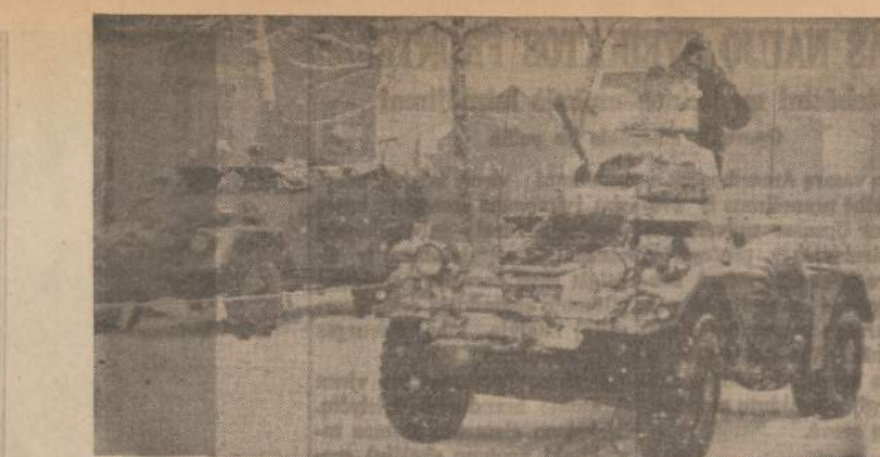
Vienos virvės siena. Britu patrulinis šarvuotas automobilis (dešinėje) ir rytinės Berlyno zonos komunistų šarvuotas važinėja iš abiejų pusių ištiesęs virvės. Raudonojoje virvės pusėje komunistų darbininkai ardo namus, kad berlyniečiams iš sovietinio sektoriaus sunkiau būtų pabėgti į Vakarų Berlyną.

Pripažįstant tėvams teisę pasirinkti savo vaikų auklėjimo kryptį bei mokyklą ir siekiant išvengti valstybės totalinės prievartos, greta valstybinių ir savivaldybinių mokyklų turėtų būti leidžiama mokyklas kurti ir laikyti kultūrinėms, profesinėms