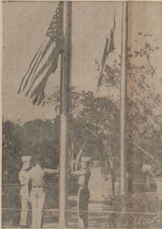
Prie Balboa aukštesniosios mokyklos Panamos kanalo zonoje iškeliamas JAV ir Panamos vėliavos. Dėl to, kad nebuvo leista iškelti Panamos vėliavos, įvyko kruvinos riaušės.

Negali skystis ne Panamos Kanalo kompanija. Ji turėjo 1963 metais $103 mil. pajamų. $58 mil. buvo iš laivų maito. Atsakaičius išlaidas kanalo išlai-