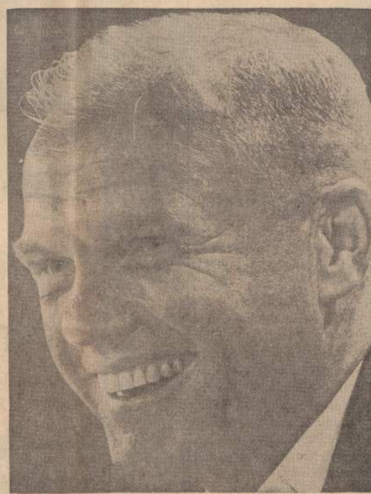
Astronautas John Glenn spaudos konferencijoje Columbus mieste (Ohio), pasiskelbė demokratu kandidatu į senatą.

PARYŽIUS. — De Gaulle vyriausybė vis tik galvoja užmegzti diplomatinis santykius su komunistine Kinija. Savo planus prancūzai išdėstė JAV vyriausybei iš išgirdo jos nustebimą bei nepasitenkinimą. Šeštadienį prancūzai parlamento delegaciją iš šešių narių (golistų) išvyksta į Kiniją, šiaurės Vietnamą ir išaursė Korėją vieno mėnesio studijų kelionei.