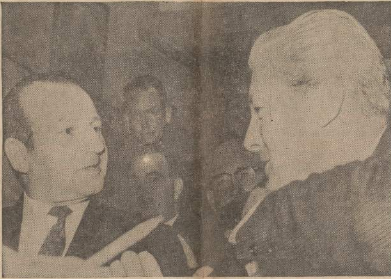
Jack Ruby (kairėje) ir jo advokatas Melvin Belli, teisme. Kaip žinia, Ruby nušovė Oswaldą, kuris buvo kaltinamas prezidento Kennedy nužudymu.

Prezidentas Johnsonas pirmadienį paragino didžiausias automobilių kompanijas (Ford, General Motors ir Chrysler) atpiginti automobilius ir pasitenkinti mažesniu pelnu. Juo pelnas didesnis, juo didesnio atlyginimo reikalauja darbininkų unija. Tai kenkia vyriausybės pastangoms prilaikyti atlyginimus ir kainas dabartinėje plotmėje.