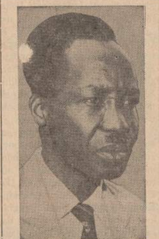
Julius Nyerere, Tanganyika prezidentas, kuris perėitą vasarą aplankė Baltuosius Rūmus ir buvo prezidento Kennedy svečias. Tanganykoje pradėjo kelti maistą kariuomenė.