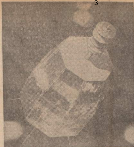
Naujas satelitas Relay-2, kuriuo Amerika palaikys radijo ir televizijos ryšius su pasauliu.