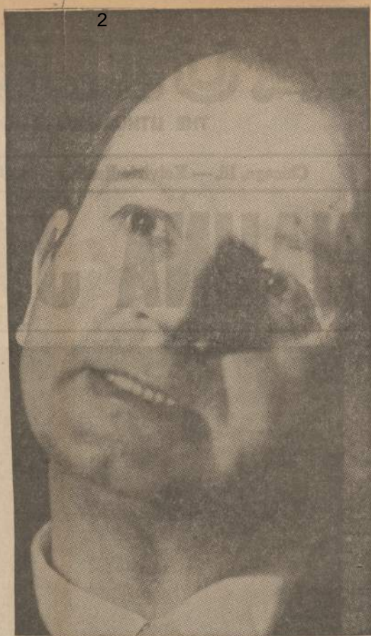
Kalbant su reporteriais Dallas (Tex.) teismo rūmuose, Jack Ruby akys pasirodė ašaros. Esa, kai jis išgirdęs apie prezidento Kennedy nužudymą, negalėjęs suprasti, kaip toks didelis žmogus galėjo būti sunaikintas. Ruby yra kaltinamas nušovimu prezidento Kennedy žudiko Oswald.