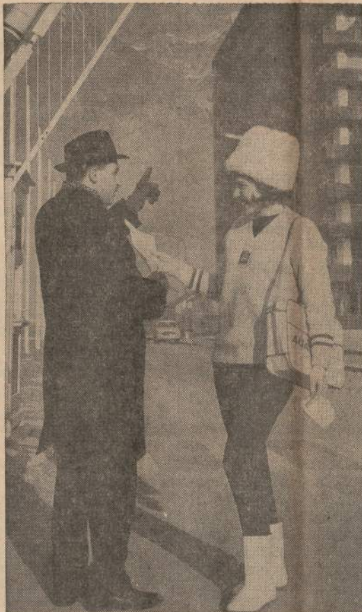
33 tautų slidininkai dalyvauja žiemos olimpinėse žaidynėse Olympic kaimė, netoli Innsbruck, Austrijoje. Šiomet pasitaikė, kad nebuvo sniego, tad į slidinėjimo vieta sniegą teko gabenti iš kitur armijos sunkvežimiais. Čia spausdinama nuotrauka buvo nuimta Innsbrucke. Atvykęs žiemos žaidynių pasiūlūrėti asmuo klausia: "Kur yra sniegas?"

Tai bus pirmas atsitikimas, kad teisiant vaistų kompanijas bus teisama skelbimų firma, kuri apsiima niekam vertą vaistą išreklamuoti.