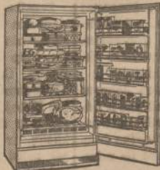
Model UFPD-12-64, 11.78 cu. ft., 4 colors or white