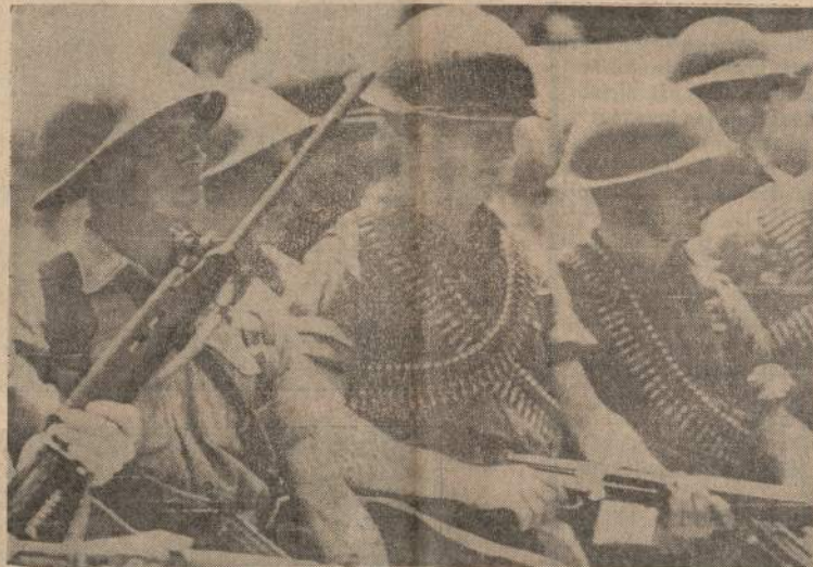
Britų kareiviai žygiuoja į Kenijos armijos kareivines, netoli Nairobi numalšinti vietinių kareivių maištą.

♦ Erie-Bufallo srities demokratai nutarė savo susirinkime reikalauti, kad kandidatu į viceprezidentus būtų išrinktas Robert Kennedy.