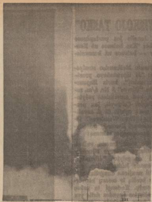
Didžiausias Echo II satelitas, 13 aukštų balionas, buvo paleistas į erdvę ir dabar sukasi aplink žemę. Su Echo II Amerika ir Rusija darys eksperimentus palaikyti susisiekti per televiziją ir radiją.

Amerika, kuri nėra susipykusi nei su graikais, nei su turkais, tokį arba panašų planą galėtų praveisti.