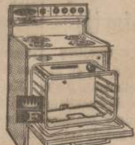
Model RD-39-64, 4 colors or white