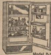
Model D-12-64, 11.6 cu. ft., 4 colors or white