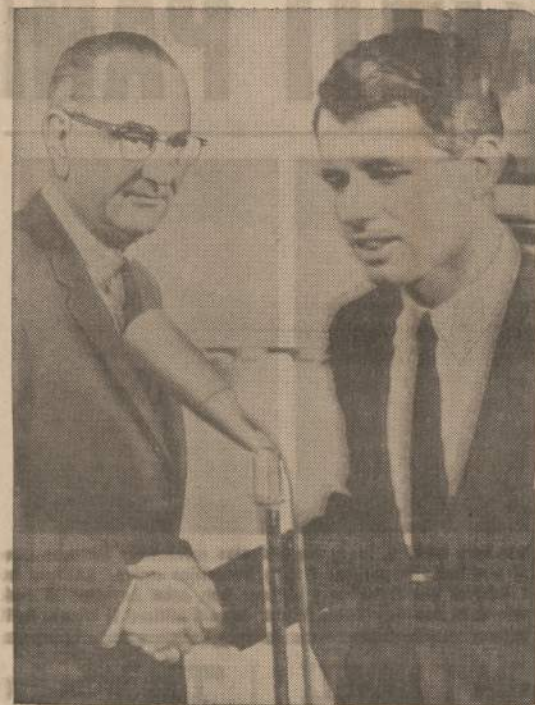
Robert Kennedy, vyriausiasis prokuroras, susitiko su prezidentu Johnsonu, grįžęs iš dviejų savaitių kelionės į Aziją ir Angliją. Prezidentas jam pavedė sutaukinti Indonezija, Filipinus su Malazija.