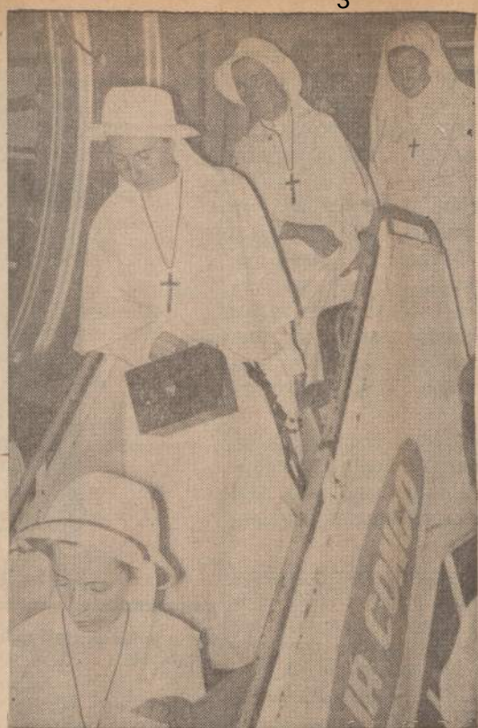
Belgų vienuolės, išgelbėtos iš Kwilu provincijos teroristų nagi helikopteriais, buvo perkeltos į Kongo kelevinį lėktuvą ir atgabentos į Leopoldville.

***** HELP STRENGTHEN AMERICA'S PEACE POWER BUY U.S. SAVINGS BONDS *****