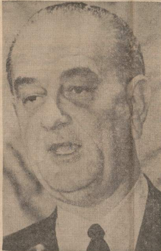
Prez. Johnsonas buvo sušaukęs šeštadienį spaudos atstovus sukrikuoti de Gaulle planus neutralizuoti Pietu Vietnamą ir kitas Pietryčių Azijos šalis, kurios iki 1954 metų priklausė prancūzų kolonijai Indokinijoje.

Radio Liberty Committee veiklos centras yra Muenchenas, Vokietija. Komiteto radijo stotys yra Lampertheime, Vokietijoje; Geronoje, Ispanijoje ir Taipeh, Formozoje.