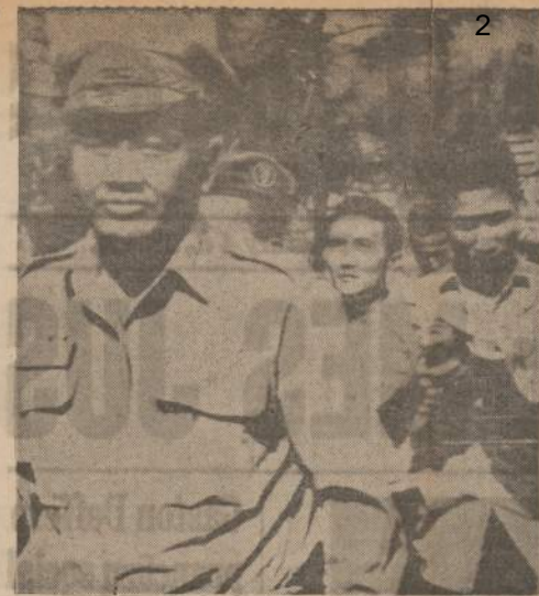
Naujasis P. Vietnamo diktatorius. — Gen. Nguyen Khanh (kairėje) Salgono gatvėse. Jis pasižadėjo asmeniškai vadovauti kovai prieš komunistus.

Atsitiko, kad anglų keleivinio lėktuvo motorai sugedo ir prisėjo nusileisti. Lėktuvas trenkė į kalvą daugiau negu 120 mylių per valandą greičiu. Pilotas buvo prisitvirtinęs prie sėdynės per jo pečius perstomis, petnešomis; jo padėjėjas buvo tik įprastiniu sėdynės diržu susisėjęs per juosmenį. Pasekos buvo tokios: pilotas išliko gyvas ir sveikas, tik truputį nusibrozdinęs; jo padėjėjas buvo vietoj užmuštas. Pastarojo lavoną skrodžiant buvo rasti sunkūs vidaus