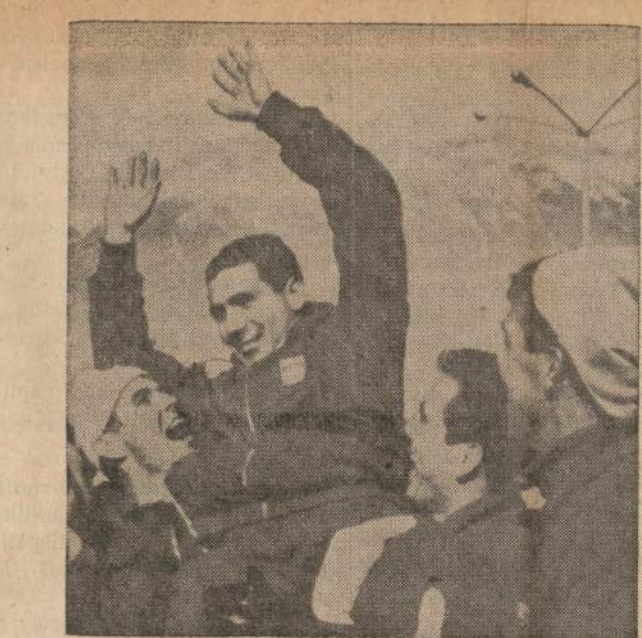
Ledo sporto žempionas. — Amerikietis Ferry McDermott iškovojo savo kraštui pirmą aukso medalį žiemos olimpiadoj Innsbrucke, Austrijoje, laimėdamas pirmą vietą 500 metrų žiūzimo lenktynėse.

Viena gera McCormick Plase kovo 7—15 dienomis rengiamos metinės gėlių ir daržininkystės parodos pusė bus ta, kad ten namų savininkai galės pamatyti specialiai padarytų modelių, kaip papuošti ir kokiais medeliais apsidinti savo nedidelius, o kartais visai mažus prie namų turimus sklypelius. Paroda apims apie 300,000 ketvirtainių pėdų plotą.