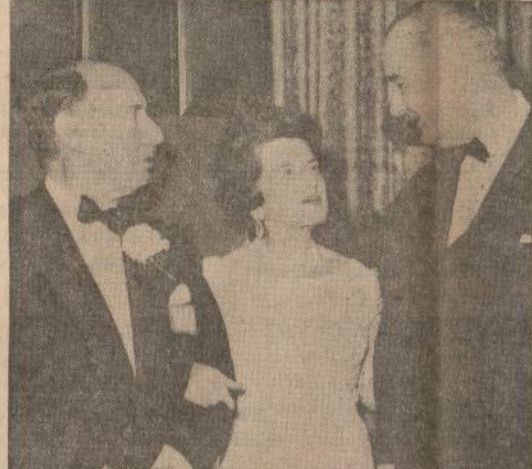
Kennedy fondacijoj. — Prezidentas Johnsonas (dešinėje), Mrs. Rose Kennedy (buvusio prezidento motina) ir ambasadorius Adlai Stevenson susitiko Joseph P. Kennedy fondacijos rautė New York, kur prezidentas pasakė kalbą apie vyriausybės norus padėti fondacijai kovoj už silpnapročių, degeneruotų vaikų grąžinimą į normalų gyvenimą.

Moteris iškėlė kongresmanui bylą už pareiškimą televizijos programoj, kad ji esanti kyšių rinkėja policininkams.