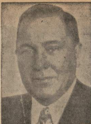
RICHARD J. DALEY

2715 WEST 71st STREET CHICAGO, ILL. 60629 TEL. 471-1424