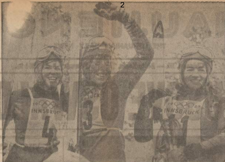
Trys austrės laimėtojos. — Žiemos olimpiados slidžių lenktynėse nuo kalno Innsbruke, Austrijoje, visas tris pirmąsias vietas laimėjo austrės. Christl Haas (viduryje) iškovojo savo kraštui aukso medalį, Edith Zimmermann (dešinėje) — sidabro medalį ir Traudl Hecher (kairėje) — bronzos.

Šiaurės Amerikos Lietuvių Fizinio Auklėjimo ir Sporto Są-