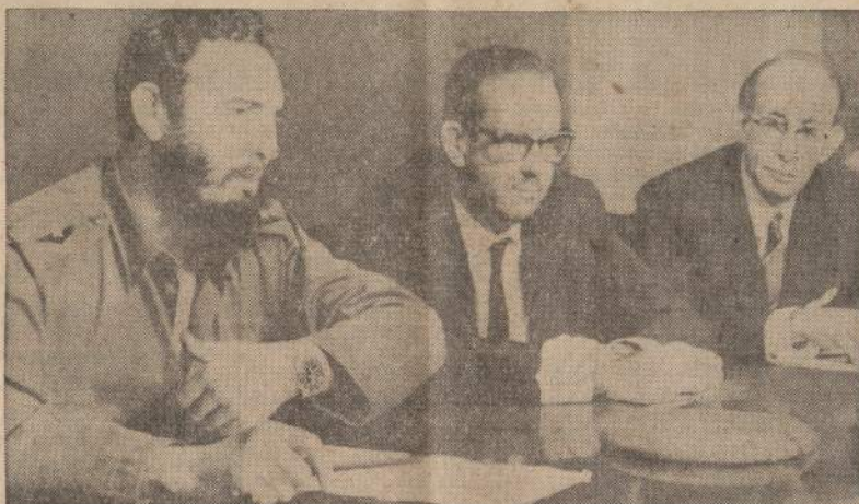
Kubos diktatorių Castro sukviėta spaudos atstovus ir pranešė jiems, kad jis nutarė sustabdyti vandens tiekimą Guantanamo srityje esančiam JAV garnizonui. Kad Guantanamo srityje esančioms moterims ir vaikams nebūtų bereikalingo vargo, jis kasdien atidarysias kranus vienai valandai ir praleisias truputį vandens. Castro reikalauja, kad būtų paleisti Floridoje suimti Kubos jūrininkai.