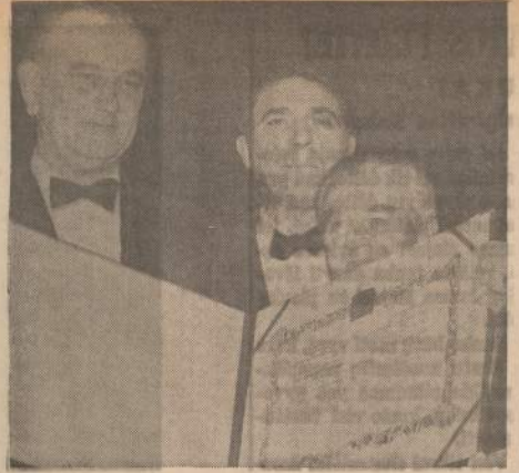
Prezidentas Johnsonas New Yorke. — Prezidentas Johnsonas buvo nuvykęs į New Yorką, kur jam buvo įteiktas Weizmanno Mokslo instituto garbės palmėjimas.

GERBIAMAS NAUJIENŲ PRIETELI, PAUKODAMAS NAUJIENŲ MASINŲ FONDUI ATLIKSI DIDELI IR GARBINGA DARBA. KIEKVIENA DIDELE AR MAŽA AUKA BUS TINKAMA ĮVERTINTA.