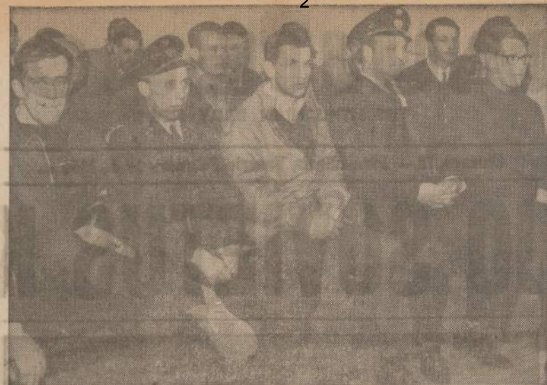
Amerikos sportininkai austrų teisme. — I olimpinis žaidimus nuvykusieji trys Amerikos sportininkai pateko į austrų teismą. Amerikiečiai sėdi tarp austrų policininkų ir klauso kaltinimų, kaip jie, gerokai girstelėję, neklausė policijos, buvo suimti, surakinti ir atvesti į kalėjimą. Jie teisėjui skundėsi, kad policija kiekvieną gerokai apkūlusi. Teisėjas atsakė šių kaltinimų klausyti, nes jis sprendė byla prieš girtus amerikiečius, o ne austrų policininkus.