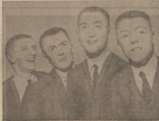
Urvinė ir civilizuota šukuosena. — Garsioji bhity rock and roll ketveriukė — The Beatles. Jų didžiausias pasiekimas — plaukų fazonas pasiskolintas iš urvinių žmogus. Apačioj parodoma, kaip tie mažamečiai mergaičių nurytėliniai atrodytu, jei apsikirptų laikintis koledžio studentų fazono.