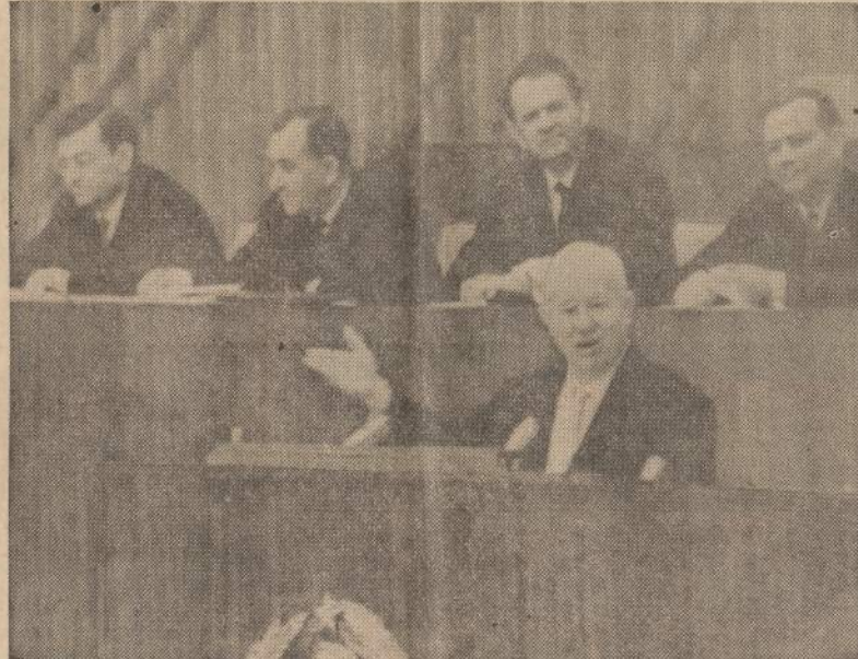
Tikras dėl pažangos. — Ministeris pirmininkas Chruščiovas, kalbėdamas žemės ūkio konferencijoje Komunistų Centro Komitete, Maskvoje, pareiškė, kad Rusija pasiveja JAV. "Kapitalistų pasaulis tikra žodžio prasme jūnta mūsų kvėpavimą", — pasakė jis.