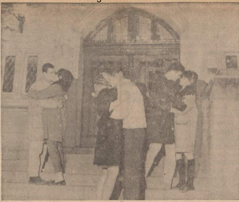
Bučinių krizė. — Bučiniai labai naktiai buvo uždrausti Indianos Universiteto (Bloomington, Ind.) mergaičių bendrabučio vestibulyje. Tas uždraudimas sukėlė studentų pasipiktinimą, ir ši grupė pasirinko bendrabučio laiptus protestui šv. Valentino diena.

Po to, dar keliems pasieniečiams toji kontrabandininkė prasmukusi ir pradingusi. Pagaliau įdomiausiai: "Taip jau mes nutarėme, kad tai vaidenasi. Matyt, kokio nors nekrikštyto ar "eretikio" vėlė vaikiojasi", o kada jau net pats rajono viršininkas susidomėjęs atvyko padėti