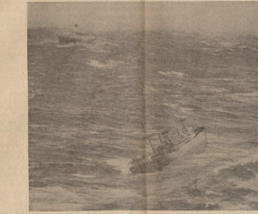
Jūreivių kapai. — Šie žaltį šiaurės Atlanto vandenys prigludė 14 anglų jūrininkų iš prekinių laivo Ambassador, plaukusio su kviečiais ir kukurūzais iš Philadelphia. Adurai pramušus laive siena, ir pradėjus laivui svirti į šoną, kapitonas davė leidimą gelbėtis. Netoliese buvęs Italų keleivinis laivas (toluom) Leonardo da Vinci atplaukė į nelaimės vietą, bet dėl didelių bangų negalėjo išgelbėti nei tų jūrininkų, kurie buvo susėdę į gelbėjimosi valtį, nei pasilikusių pakrypusiame laive. Iš 35 jūrininkų 15 žuvo, jų tarpe laivo kapitonas.