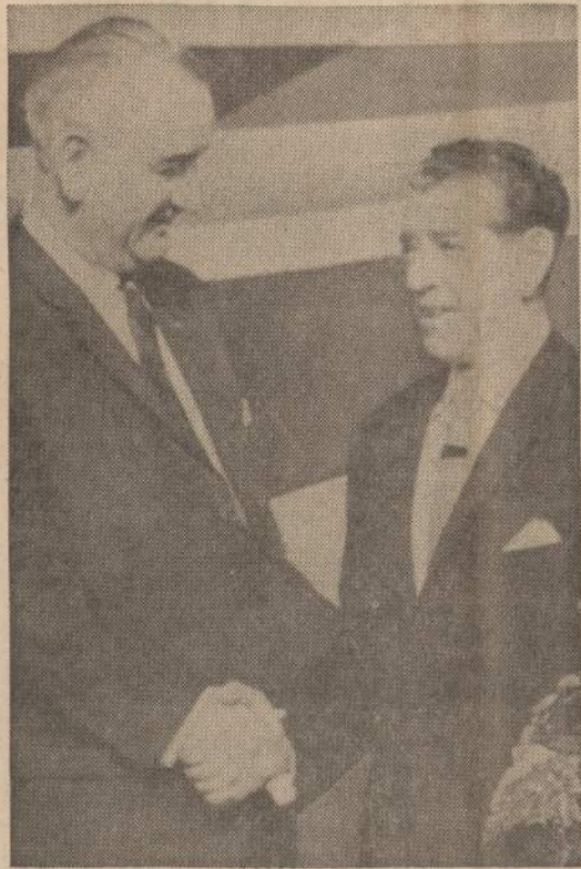
Du prezidentai. — Lyndon Johnson sveikina Meksikos prezidentą Adolfo Lopez Mateos Los Angeles mieste.

John Grigg daro išvadą, kad vieną dieną anglai pasidarys dėkingi, jog de Gaulle privertė