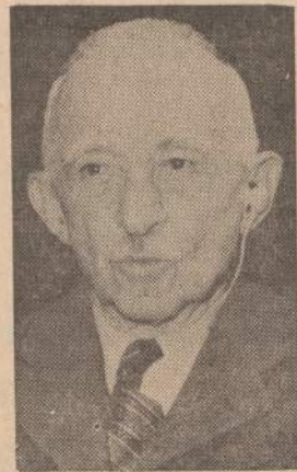
Turkas išvengė mirties. — Turkos ministeris pirmininkas (buvęs prezidentas) Ismet Inonu, 79 metų, išvengė mirties, nežiūrint trijų kulku, paleistų pasikėsintojo iš 20 pėdų atstumo.