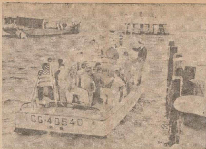
Fidelistai plaukia namo. — Kubos žvejai plaukia JAV pakrančių apsaugos kateriu Key West, Fla., uoste į savo 4 laivus - tralerius. Teismas nubaudė visu 4 laivų kapitonus po $500 už žvejimą Floridos vandenynė.

JAV senatorius Philip A. Hart (D., Mich.) kalbėjo trumpai, paliesdamas tik du klausimus. Pirmiausia jis sakė, kad daug-