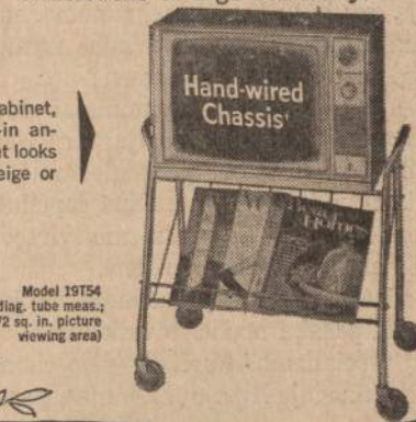
Model 19154 (19" overall diag. tube meas. 172 sq. in. picture viewing area)