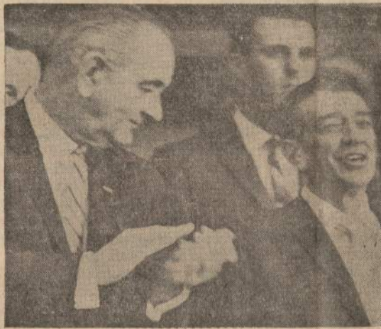
Prez. Johnsonas fiestoj. — Prez. Johnsonas ploja kalbant Meksikos prezidentui Lopez Mateos Los Angeles sporto arenoje, kur po dviejų dienų pasitarimų buvo surešta atsiverteikimo piknikasfiesta.

Amerikos kritikuotojams traukti savo pusėn prancūzų nacionalistus, kurie savo tautą, savo valdžią laiko daugiau patyrusią užsienio politikoj už Ameriką. Pagaliau Prancūzija niekad nebūvo apsisivaliusi nuo antiamerikizmo. De Gaulle išsireiškimas "anglosaksai" pasidarė žodžiu paniekinti amerikiečius ir anglus.