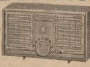
Model A26, white, blue, beige

Slim, trim styling and famous Motorola quality. Big 4" speaker delivers amazing sound quality.