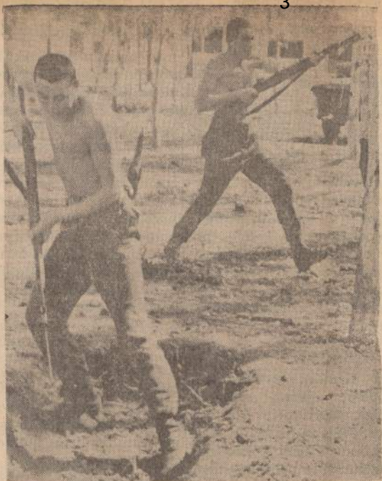
Turkai ginkluojasi prieš graikus. — Kipro salos turku kareiviai mokosi durtuvų kovos. Turkai turi Kipre 600 kareivių, graikai — pora tūkstančių.

Beje, Jono Eivenio kalibro "tyros tėvynės meilės patriotai" buvo pradėję kurti tokią Lietuvą, kokia buvo Rusija ir dvarų išsaugojimui jau buvo pasikvie-