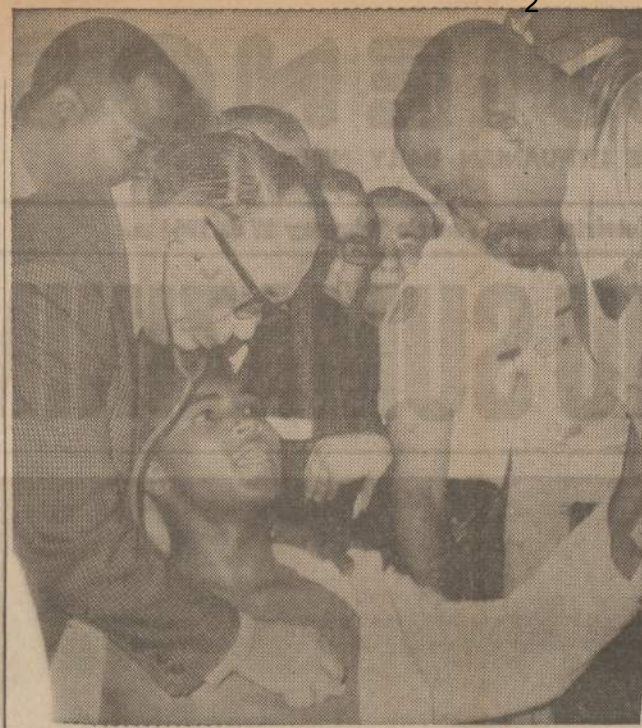
Naujas bokso čempionas. — Cassius Clay, naujasis pasaulinis sunkaus svorio bokso čempionas, tyčiojasi prieš rungtynes iš savo priešo Sonny Liston, kurį jis kiek vėliau nuvalnikavo, nustebindamas sporto pasaulį.

NAUJIENŲ MAŠINŲ FONDAS, 1739 S. Halsted St., Chicago 8, Illinois NAUJIENŲ BENDROVĖ