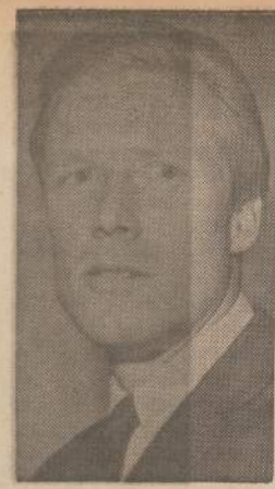
Sinatros pagrobimo liudininkas. — Rock and Roll dainininkas Dean Torrance paprašė teisme leisti atitaisyti jo paties klaidingus parodymus, duotus po priekaito, sprendžiant jaunojo Frank Sinatros pagrobimo bylą Kalifornijoje. Jis yra Sinatros draugas, bet draugas ir su jo pagrobėjais. Žinios iš anksto pagrobimo planus, bet netikėjęs, kad planuotojai rimtai galvoja. Po pagrobimo jis gavo $25,000 pinigų iš tos sumos ($250,000), kuri išmokėjo senasis Sinatra. Vėliau pinigų gražinęs. Teisme kilo įtarimas, kad Sinatros pagrobimą suorganizavo jo biznio agentai dėl reklamoms.

Į Las Vegas, tą tiek išreklamuotą miestą įvažiuavome tik po dešimtos ryto. Miestas gražus, turi daugybę naujų pastatų, puikių krautuvų ir restoranų. Motelių kiemuose įrengti basiniai maudymuisi. Miesto centre, Fremont gatvėje yra lošimų klubai. Iš lauko pusės jie papuošti įvairių spalvų šviestais, ir naktį iš tolo matomi. Klubai pritraukia daugybę svečių. Daugelis iš jų pralošia čia stambias sumas, daugelis būna priversti užstatinė-