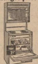
RCOH-637V, 30", electric 4 colors or white

FRIGIDAIRE Space-Saving TWIN 30 at a budget price!