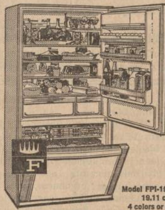
Model FPI-19B-64 19.11 cu. ft., 4 colors or white

New! 19-cu. ft. FRIGIDAIRE Imperial Nineteen! Frost-Proof!