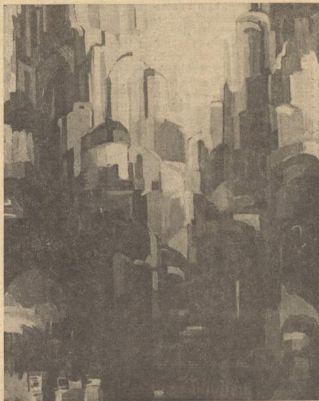
S. M. Mercedes S S C