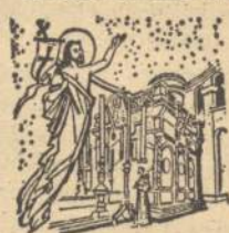
The Holy Sepulchre

The sons of St. Francis need Priests and Brothers for work at the Sacred Shrines and in the Lands of the Bible.